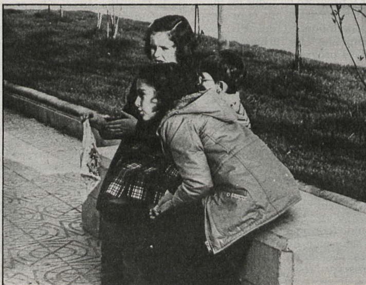
Los centros de educación infantil deben mejorar su calidad y aumentar sus dotaciones en muchos casos