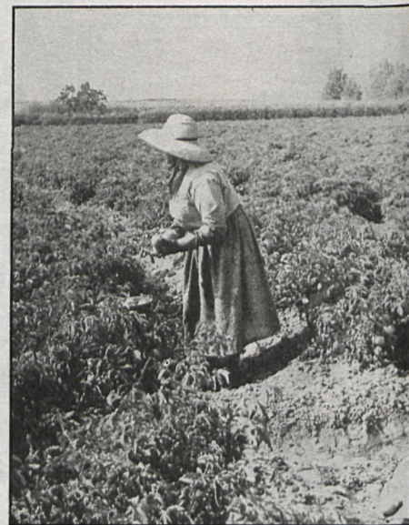
La comunidad autónoma deberá frenar el deterioro progresivo del campo y la sierra madrileña