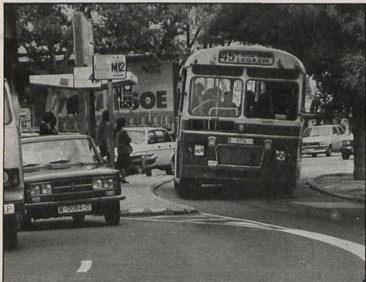
A nivel de Madrid-capital deben solucionarse los problemas del transporte colectivo

10) Un mayor esfuerzo en la mejora del medio ambiente. Una legislación más estricta sobre el particular y una fuerte vigilancia sobre la misma, así como la utilización de las medidas sancionadoras al respecto. Una política de mejora del medio ambiente pasa también por una ciudad más limpia.