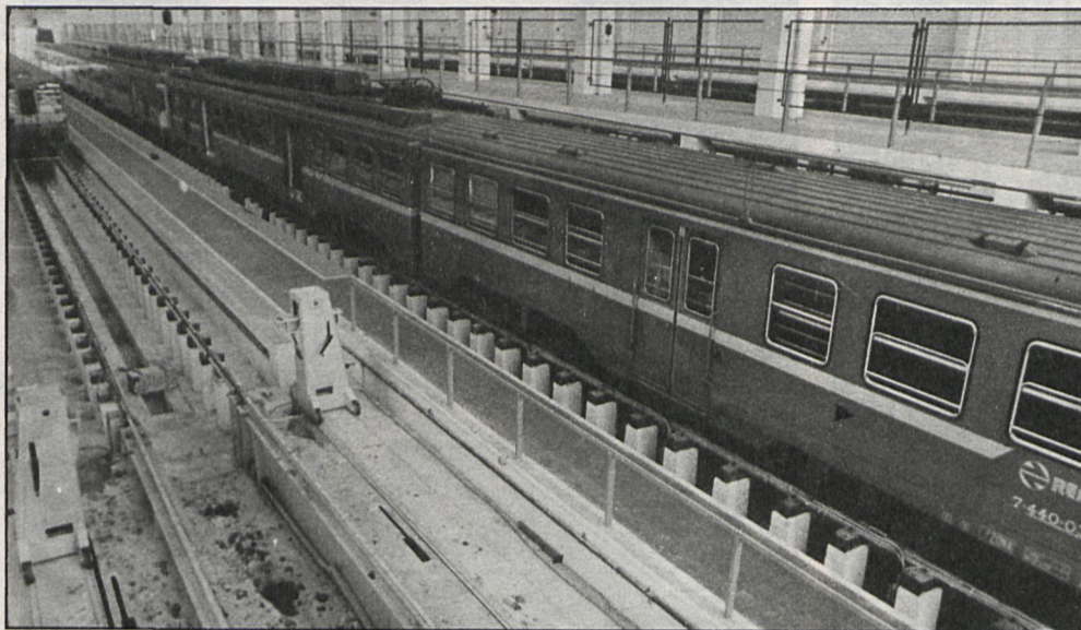
Actualmente falta una red adecuada de servicios de trenes de cercanías