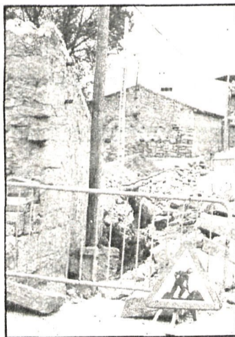
Las obras realizadas en Becerril durante los últimos años, con el fin de mejorar el abastecimiento de agua, han supuesto una inversión de 64 millones de pesetas

Anteriormente el Ayuntamiento ha venido realizando ampliaciones y mejoras en el abastecimiento desde que en 1981, con personal acogido al seguro de desempleo, se realizaron obras de recogida y reparación y ampliación de tuberías, con las que se amplió la