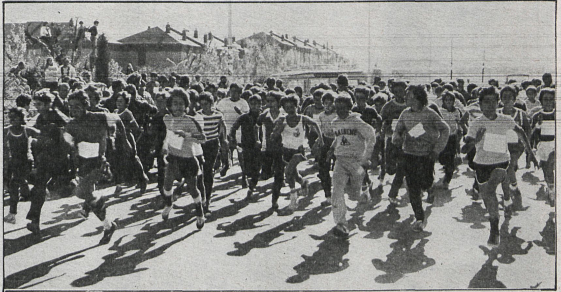
Los maratones populares son parte fundamental de la nueva medicina del esfuerzo

Como complemento de esta campaña, que alcanza a toda la población de Aranjuez y comarca sin exclusión de sexo o edad, se cuenta con la coopera-