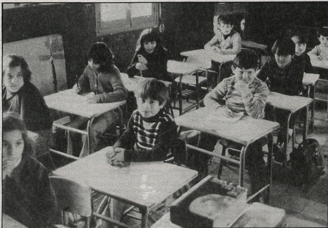
El deterioro progresivo del grupo escolar Carlos Ruiz, de Estremera, preocupa a los vecinos de la localidad

Desde que se hundió el techo de este aula, la mitad de los niños permanecen sin colegio, con el consiguiente retraso en sus estudios, máxime cuando se encuentran casi a finales de curso. La denuncia viene motivada por la escasa seguridad demostrada en este grupo escolar y por el retraso en las obras de acondicionamiento, que deja a la mitad de los niños sin colegio en unas fechas clave de finales de curso.