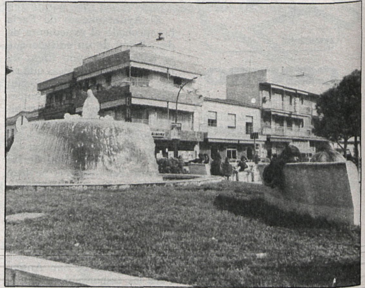
El Plan General de Getafe prevé para el Sector III la construcción de un total de 7.258 viviendas

Así, en la zona se encuentra ubicado uno de los parques de mayor extensión de Getafe además de otra serie de insta-