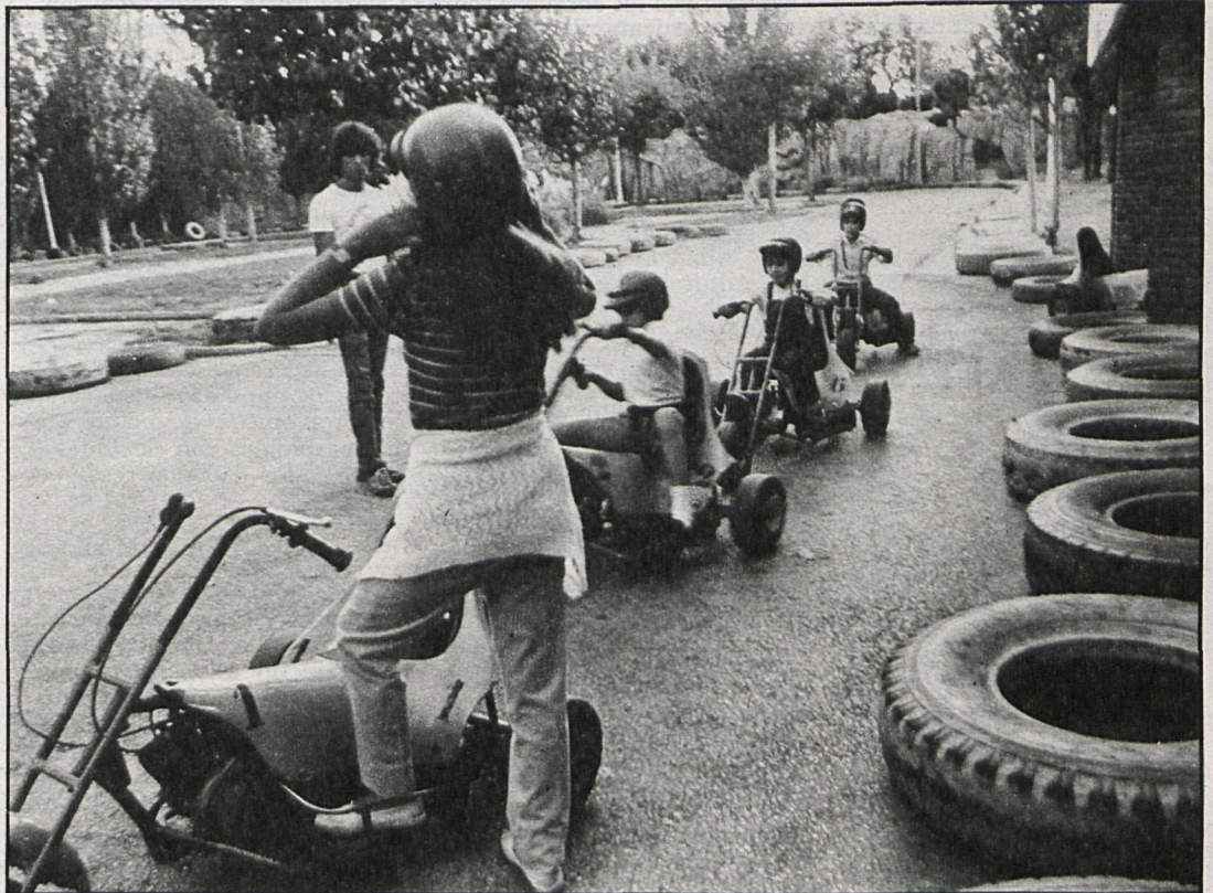
Actualmente, el único parque de atracciones existente en la región es el situado en la capital, del que vemos una de sus instalaciones

El nuevo parque estará ubicado en el antiguo parque ferial, cerca del polideportivo, en unos terrenos muy valiosos y bonitos, que están totalmente infrautilizados, ya que no se utilizan más que ocho días al año, durante las fiestas, y nosotros pretendemos con este proyecto que se utilicen los trescientos sesenta y cinco días.