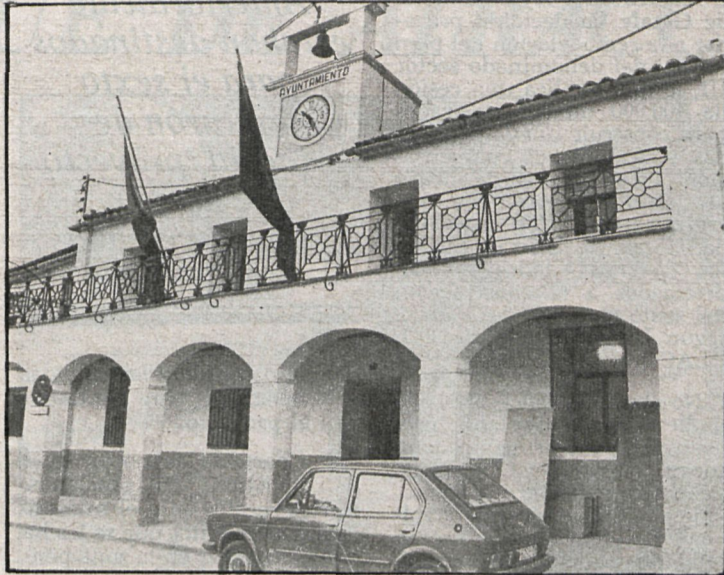
El Ayuntamiento, que vemos en la fotografía, apercibió al propietario del edificio de las infracciones que se estaban cometiendo durante su construcción

A pesar de haberse construido sin la aprobación del Ayuntamiento, se ha tratado por parte de la Corporación de encontrar alguna medida alternativa a la demolición del edificio. Sin embargo, y dadas las