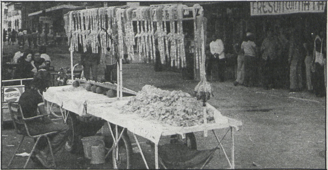
Los puestos de venta de fresas y espárragos se han convertido en algo típico en las calles de Aranjuez