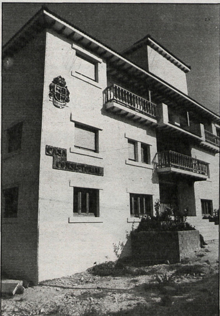
Algunos vecinos opinaban que el nuevo edificio era «muy grande» para el pueblo

El jueves día 28 fue inaugurada la iluminación de las instalaciones deportivas del campo de fútbol del C. D. Mostoles. Con motivo de la inauguración se disputaron dos encuentros de fútbol, uno de categoría juvenil y otro en el que se enfrentaron el equipo local, C. D. Mostoles, que limita en la Preferente, y el Moscardó, equipo de la Tercera División nacional. Asimismo hay que felicitar al equipo mostoleño por el reciente estreno de su sede social, que fue inaugurado días atrás y que se encuentra en la calle Río Genil, número 17, de esta localidad.