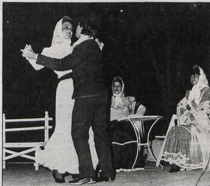
A partir del domingo, la imagen de muchos chulapos y chulapas recorrerán nuestras calles

En el Retiro, a partir de las ocho de la tarde, habrá cuatro actuaciones diarias durante toda la semana. Entre los grupos que van a intervenir están Hilario Camacho, la Orquesta Platería, La Mode, Juan Carlos Senante, Girasol, Chunguitos, Burning, Un Poquito de Todo, Manzanita, P.V.P., Gato Pérez, Frutos Tropicales, Labanda, Doctor Feelgood y Suburbano.