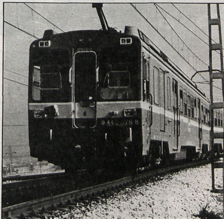
La prolongación de la línea dentro de la localidad supondrá un importante avance para las comunicaciones

El Instituto de la Opinión Pública IDES realizó esa última encuesta entre el 17 y el 24 de marzo pasado, con una muestra de 1.097 vecinos, distribuidos en grupos de edades en forma proporcional a la composición de la po-