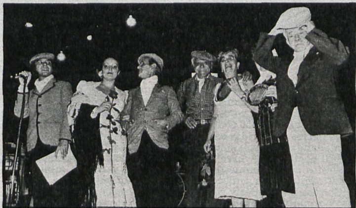
Los actos «castizos» son ya algo habitual en las fiestas de San Isidro

consolidación de la recuperación de los tres años anteriores». En cuanto al presupuesto de 110 millones de pesetas, Ramón Herrero hace diversas matizaciones: «calculamos que los ingresos en las actuaciones que no son gratuitas ascende-