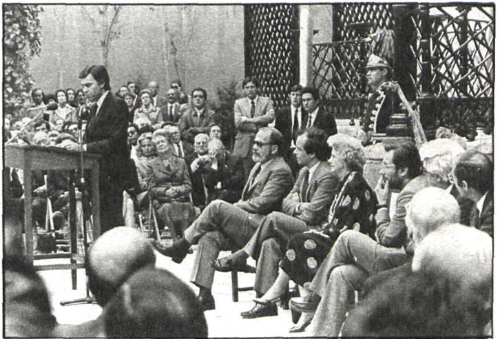
El presidente del Gobierno, Felipe González, durante su intervención en la apertura del Centro Ortega y Gasset

Una reposición que merece todos los honores es la de «Scarface», una de las grandes obras del cine policíaco debida a Howard Hawks. No se puede dejar pasar, hay que verla o volver a verla, en el cine California.