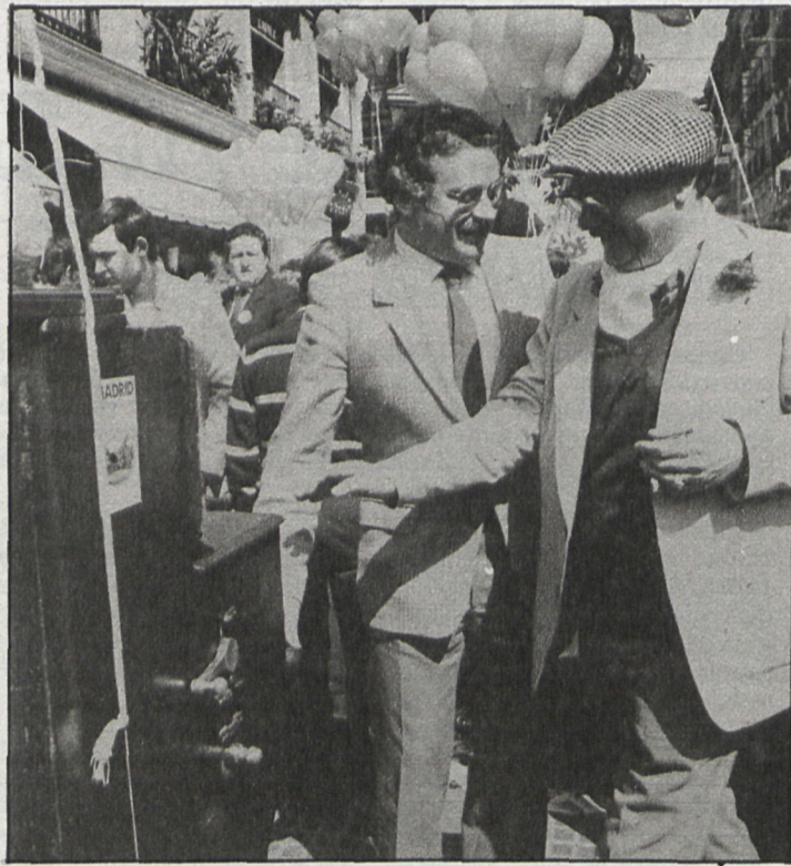
Joaquín Leguina ha hecho campaña en plena calle. Aquí le vemos en Preciados, junto a un típico organillo madrileño

do Socialista Chileno, integrándose también en el Frente de Liberación Popular de nuestro país, del que fue miembro desde 1965 a 1969. Ya en 1979 se presentó a las elecciones municipales en la capital de España como candidato del Partido Socialista Obrero Español. Durante los últimos cuatro años ha ocupado el puesto de concejal de Hacienda del Ayuntamiento de Madrid. Fruto de su gestión al frente de este departamento es una Hacienda saneada y racional, muy diferente de la que heredaron las corporaciones democráticas salidas de las urnas hace cuatro años.