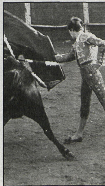
Los novilleros dieron paso a la cálida isidrada