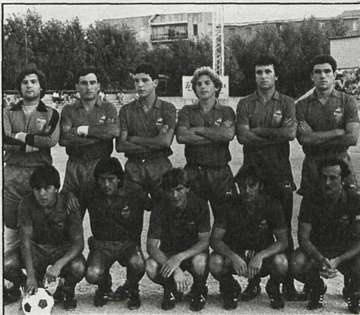
El Aranjuez, virtual campeón de Tercera

Alcalá-Antequerano. — Partido de enorme responsabilidad para los complutenses, puesto que los malagueños ocupan el tercer lugar de la tabla y la