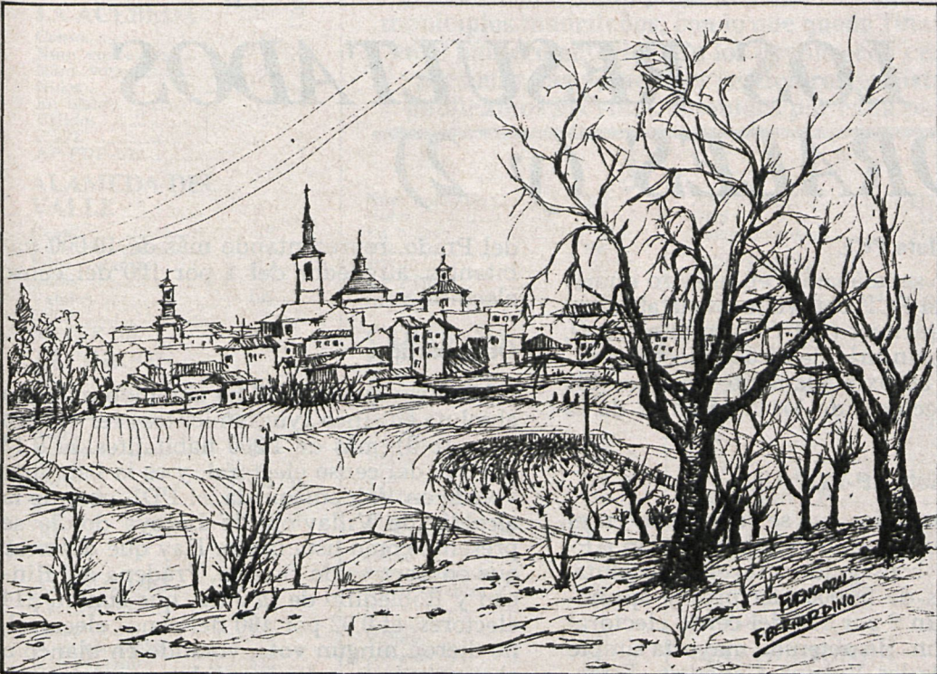
El pueblo de Fuencarral sólo se libra por el Norte de la presión urbana. Se trata de salvar un pueblo auténticamente castellano, con el sabor rural e íntimo que aún mantiene