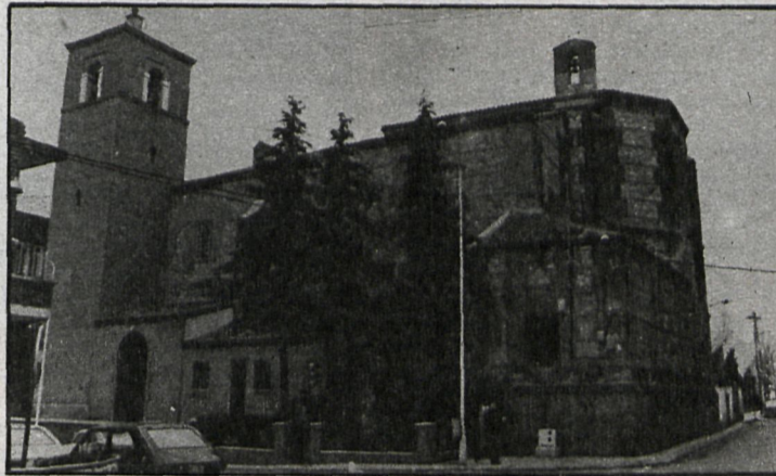
Iglesia de Santa María La Blanca

puesto de cuatro millones y medio de pesetas en la remodelación de la plaza en la que se encuentra situada, reestructurándola de tal forma que puede ser un agradable lugar de estancia para los vecinos de Alcorcón.