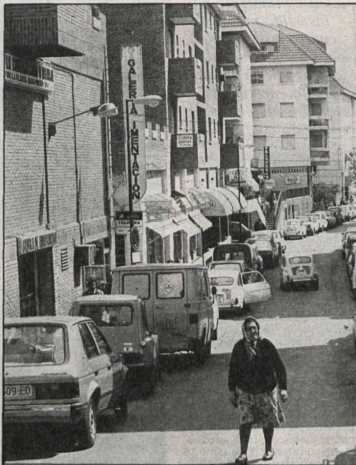
El Plan General autorizará la construcción en el casco urbano de edificios con una altura de hasta tres plantas en las calles de nueve metros de anchura

En el casco se autorizará la construcción de hasta tres plantas en las calles de nueve