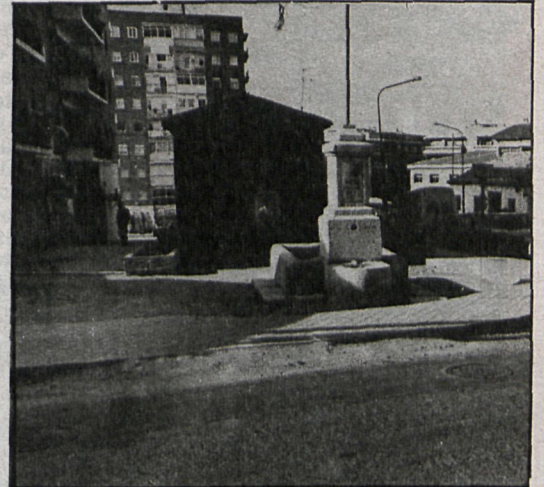
En las dos fotografías se aprecia el cambio experimentado en la plaza de la Fuente Vieja, tras una primera fase de su remodelación. En la actualidad se han instalado también bancos, faroles y otros elementos decorativos