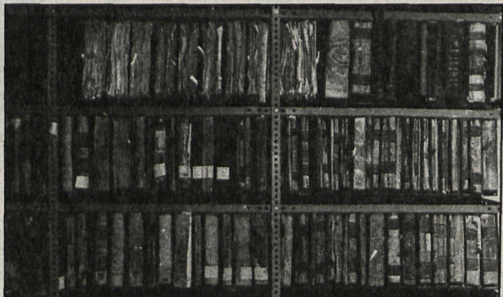
Los legajos han sido clasificados por personal de la Diputación de Madrid

La lucha contra los franceses fue un gesto heroico por parte de los vecinos de El Escorial, y por aquel motivo el rey Fernando VII le concedió el título de Leal, cuya cédula real se conserva en el archivo.