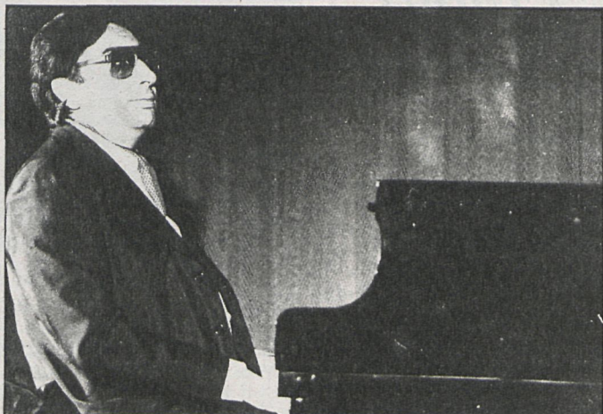
Tete Montoliú durante su actuación

En todos los temas que interpretó hubo poco o casi nada de improvisación y se echó en falta el frasco de esencias del genio que él ha demostrado ser en numerosas ocasiones. Los temas que interpretó eran del más riguroso clasicismo, llenos de limpieza y de un equilibrio tan perfecto que permitía mantener distantes, aunque no indiferentes, a una buena parte del público que siempre adi-