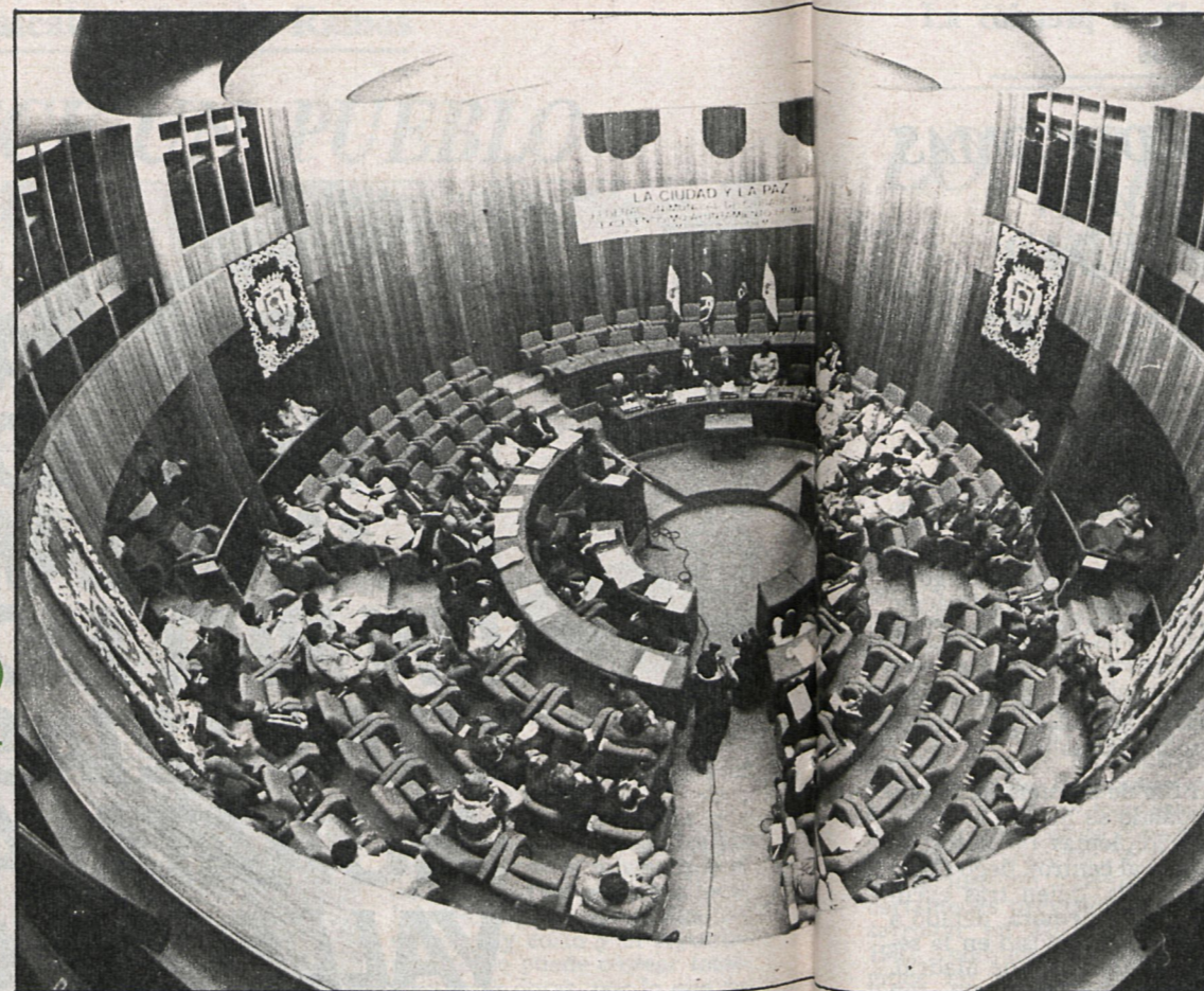
En la conferencia se dieron cita más de cien alcaldes de treinta países

Por otra parte, las ciudades de Europa, del Este y del Oeste, y especialmente las capitales nacionales y regionales, recomendaron la constitución ante la FMCU de un consejo internacional para la distensión, el desarme y la paz. La convocatoria, por iniciativa de la Asociación de Ciudades Búlgaras, y de acuerdo con la Unión de Ciudades Mediterráneas, de una conferencia sobre el Mediterráneo y la Paz, abarcando también el mar Negro y el Adriático, para el otoño de 1984. Su última propuesta escrita en la apertura, ante la FMCU en Sofía, de un centro de urbanismo, destinado a recoger y difundir el máximo de informaciones que interesen a las ciudades en cuanto a los problemas de urbanismo.