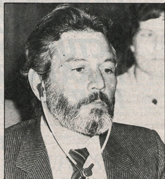
Sobre estas líneas, los alcaldes de Managua (izquierda), a la derecha