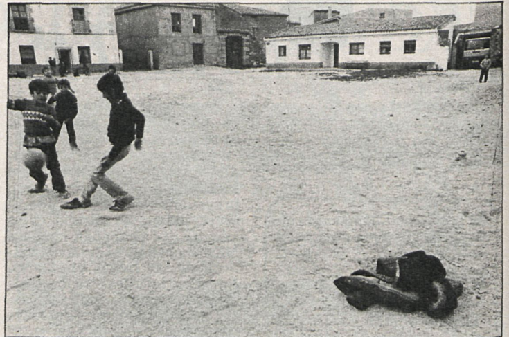
La mitad de las calles de Cenicientos están aún sin pavimentar

También existen en la localidad muchas calles sin pavi-