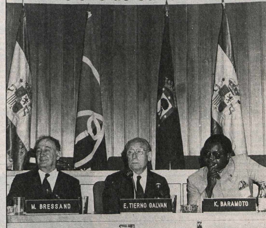
Enrique Tierno Galván, alcalde de Madrid, presidiendo la mesa de la conferencia

Los cuatro últimos puntos del llamamiento son: Aplicación de los mismos principios de igualdad y reciprocidad, tanto al este como al oeste de Europa, en lo que se refiere a toda medida que favorezca el desarme. Un mejor intercambio de informaciones, así como el reforzamiento de la educación de los jóvenes y adultos sobre los problemas de armamento, distensión y cooperación. Previsiones concretas en los programas de las organizaciones intergubernamentales, teniendo en cuenta en su elaboración el importante papel que desempeñan las colectividades locales y regionales dentro del desarrollo de la cooperación económica y social. El último punto hace referencia a la movilización municipal, con todas sus posibilidades culturales, sociales y económicas, para realizar acciones tendentes al desarme y con vistas a la cooperación internacional, a un desarrollo solidario y a un mayor respeto por los derechos humanos, particularmente la no discriminación ideológica, filosófica, religiosa, racial, etc., que son los fundamentos más seguros de la paz.