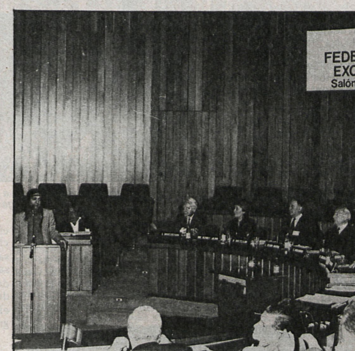
Uno de los alcaldes que participan en la conferencia, procedente del continente americano, durante su intervención

La solicitud en favor de la desnuclearización propuesta por el Ayuntamiento de Madrid no fue aceptada y quedó aplazada para una próxima conferencia. Respecto a este aplazamiento en su discusión el alcalde de Madrid manifestó que no fue posible su aprobación por «la falta de madurez y «crimen más grave contra la humanidad». Congelación de los arsenales estratégicos y nucleares y de la producción de armas de destrucción masiva.