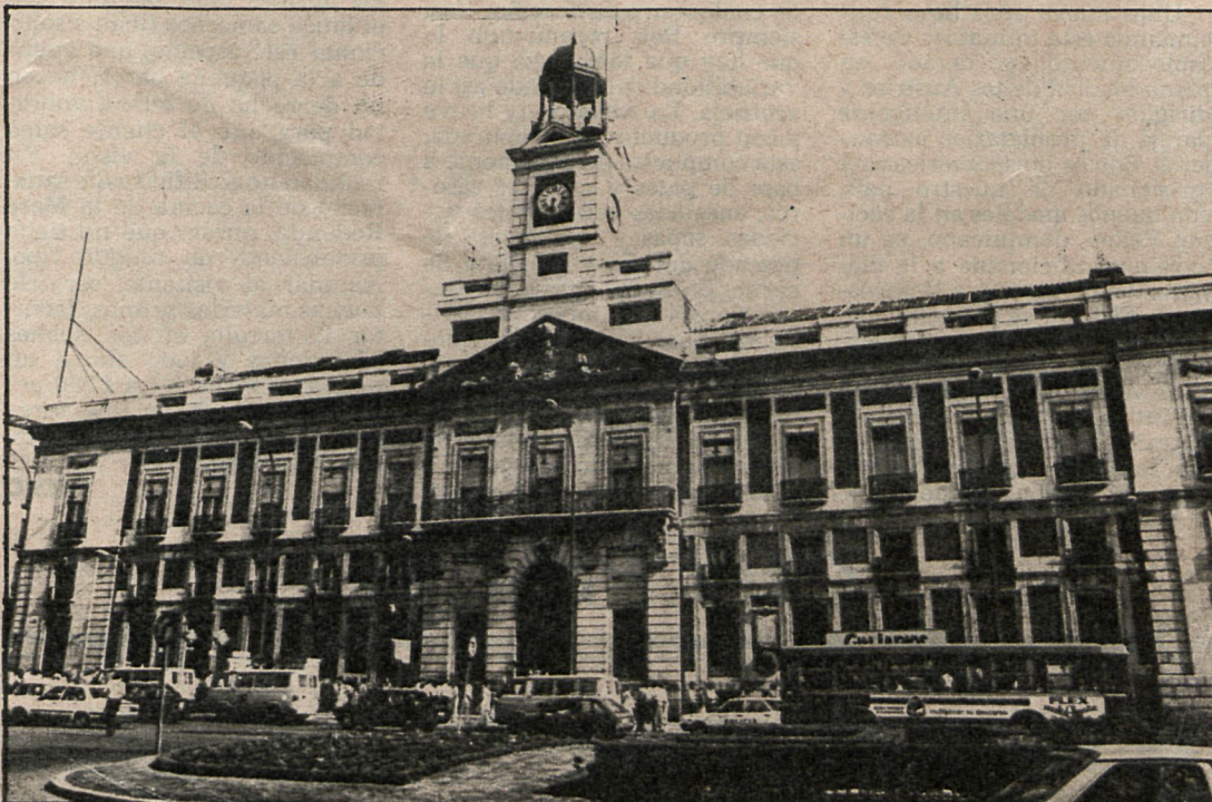
Aspecto exterior de la sede de la Jefatura Superior de Policía —antigua Dirección General de Seguridad— que albergará distintas dependencias autonómicas

Se va a instalar en los edificios ocupados actualmente por la Jefatura Superior de Policía y el Cuartel de Zaragoza