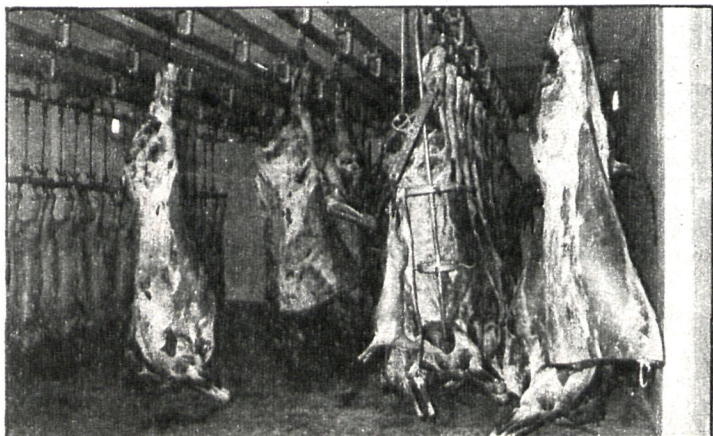
Gran número de excedentes en carne de vacuno, frente al pequeño número de mataderos colaboradores y reducidos cupos, son los motivos de la problemática actual del sector

Con la compra de medias canales se pretende retirar la carne sobrante en los momentos de mucha oferta, lo que influirá en la estabilidad del precio y disminuirán las compras por parte del FORPPA. Se autoriza también la concesión de restituciones a la exportación para aumentar la presencia de la carne de porcino en los mercados internacionales.