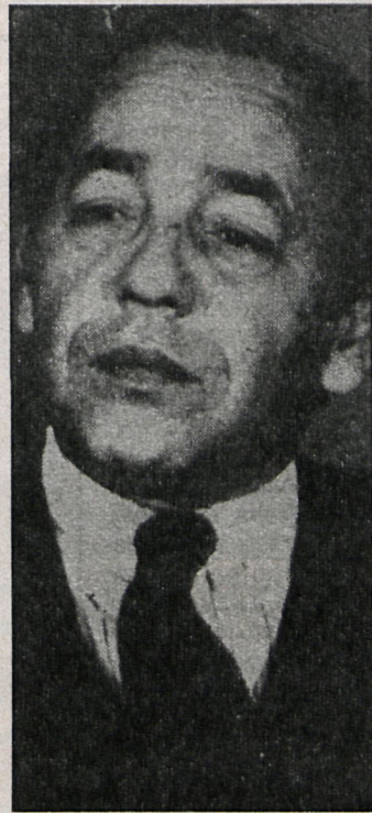
Hassan, jefe discutido, continúa sin resolver el conflicto del Sahara

Lo único que dejaron claro las elecciones es que, según los resultados, los comunistas casi no existen y los socialistas poco más. Entre todos sumarían alrededor del 4 por 100 de los sufragios emitidos, y aunque ha habido acusaciones de