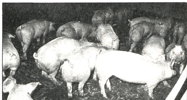
Las reservas indicativas de porcino se han reducido, pero por primera vez se facilitan ayudas por el almacenamiento

A las 5.000 toneladas previstas para retirar en el mes de julio hay que sumar las 7.000 retiradas por el FORPPA en los meses precedentes.