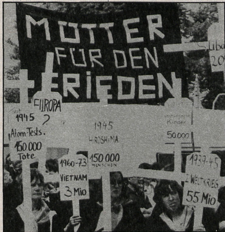
Las pancartas contra las guerras pasadas y futuras son un tema constante en la República Federal Alemana

En la foto, tomada durante una manifestación pacifista celebrada en Hannover con motivo del Congreso de la Iglesia Evangélica Alemana, el grupo de madres a favor de la paz recuerdan con las cruces que portan las víctimas que costaron las guerras. (DaD.)