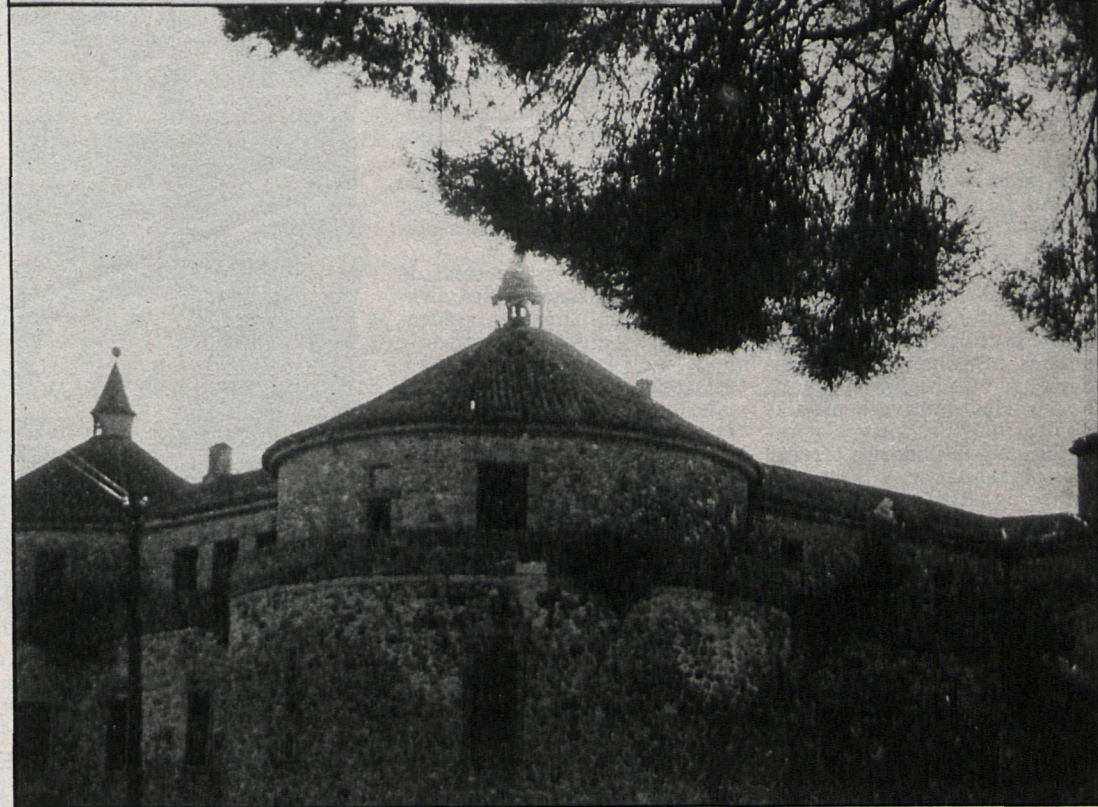
El plan contempla la protección de las construcciones históricas del municipio

Milanesa y ribera del Guadarrama, y, por último, dedicar una protección especial para las vegas, vados y riberas, montes y dehesas. En definitiva, superar la dificultad que la expectativa urbanística planteaba al aprovechamiento intensivo de las posibilidades agrarias del municipio.