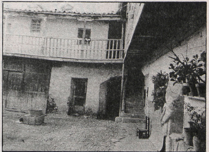
La fotografía muestra una imagen típica del ya conjunto histórico-artístico de Aranjuez

El Consejo de Ministros, bajo la presidencia de Felipe González, ha aprobado recientemente, a propuesta del ministro de Cultura, Javier Solana, la declaración del casco viejo de Aranjuez como conjunto histórico-artístico. Esta es una importante decisión del ejecutivo, que ha superado finalmente las barreras que se oponían a la resolución del expediente, según puso de manifiesto el propio portavoz del Gobierno, Eduardo Sotillos, en la habitual rueda de prensa tras el Consejo de Ministros