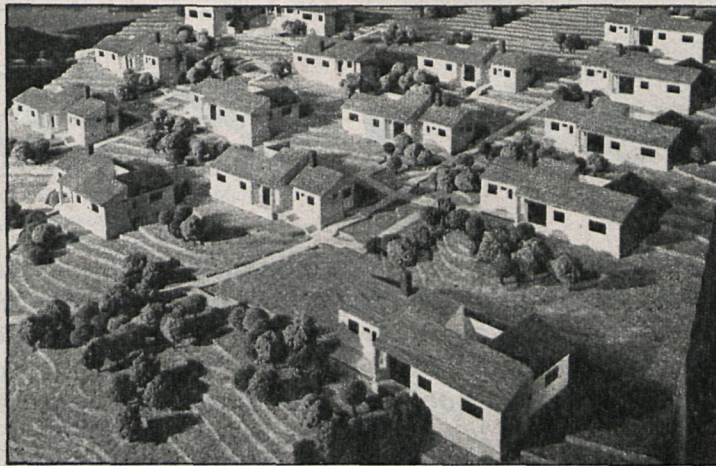
Maqueta de la aldea infantil en los terrenos cedidos por el Ayuntamiento; una vez construida tendrá doce casas, que albergarán a un total de cien niños. La inauguración está prevista para 1984

Ayuntamiento en el paraje conocido como Machuco-Cebadillas , el pasado día 22 se inauguró en la Casa de la Cultura una exposición, acompañada de proyecciones, sobre los objetivos y realidades de la iniciativa que comentamos. Las aldeas infantiles, además de acoger a niños huérfanos y desamparados, son centros educativos donde sus pequeños inquilinos se agrupan en torno