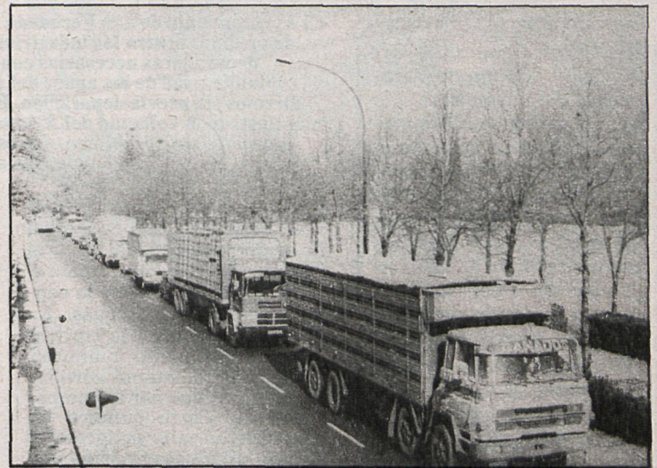
El tráfico en la N-IV, de Andalucía, a su paso por Aranjuez, sigue constituyendo un embotellamiento permanente

La asociación de afectados por el desvío de la carretera de Andalucía teme que una vez efectuado el nuevo trazado (cuyas líneas maestras ya han sido sobradamente publicadas en CISNEROS) los turistas o automovilistas de paso a Anda-