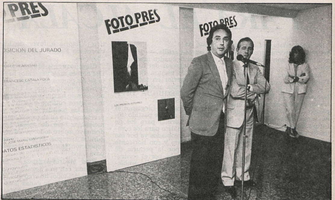
Uno de los organizadores expresó su agradecimiento a todos los participantes en el Fotopres 83, que fue inaugurado recientemente en las salas de la Caixa en Madrid

La calidad y nivel de los informadores gráficos españoles en nada se diferencia con las mejores instantáneas de sus colegas extranjeros. Sin embargo, una diferencia se aprecia, y no imputable a los «porteadores» de la Nikon o la Canon de este país, y es la falta de contacto con el exterior. La gran