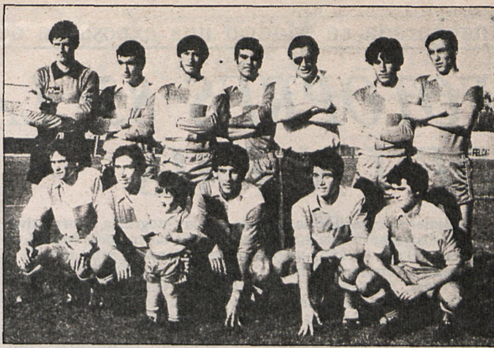
El Ciempozuelos, que siempre lucha con energía durante los noventa minutos de los partidos, juega esta semana con el Móstoles

Daimiel-Leganés. — El inconveniente mayor para los leganeses es el terreno de juego de los manchegos; pequeño y muy seco. Puestos a comparar, la ventaja es favorable a los blanquiazules, pero ya digo que el suelo y las dimensiones son el hándicap más acusado.