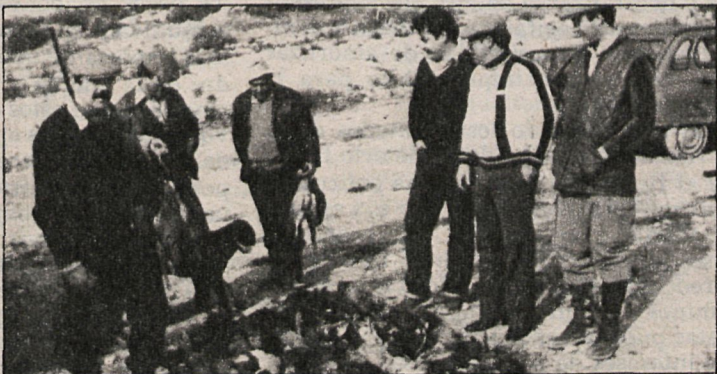
Escenas como éstas, donde la captura de piezas era abundante, serán cada vez más difíciles en la temporada que comenzó el domingo pasado