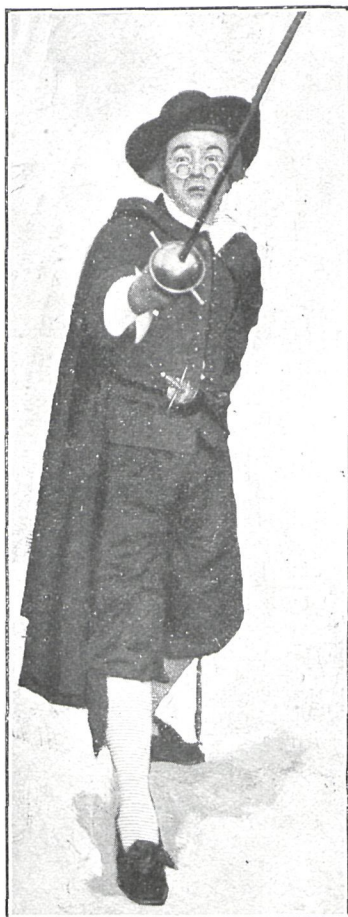
QUINTANA (Sr. Rubio)