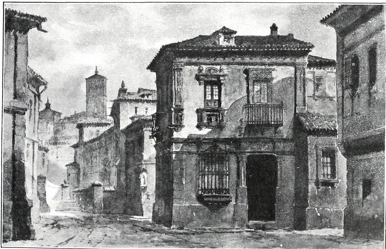
DECORACIÓN DEL ACTO TERCERO. (SEGÚN BOCETO DE LOS SRES. AMORÓS Y BLANCAS)