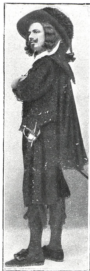
DON JUAN (Sr. Tallavi)