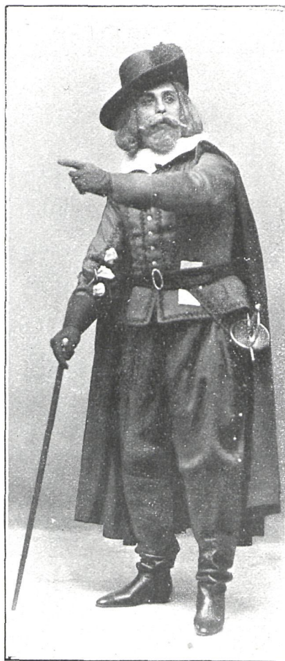
DON DIEGO (Sr. González)

La moza de cántaro , y ni la obra de este título ni la que él rotuló Don Lucas del Cigarral motivaron semejantes quejas; al contrario, fueron muy y muy justamente alabadas, y eso que en ellas se habían alterado mucho más que en la refundición de Don Gil los textos clásicos.