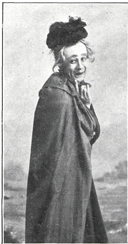
EN «EL RELÁMPAGO»