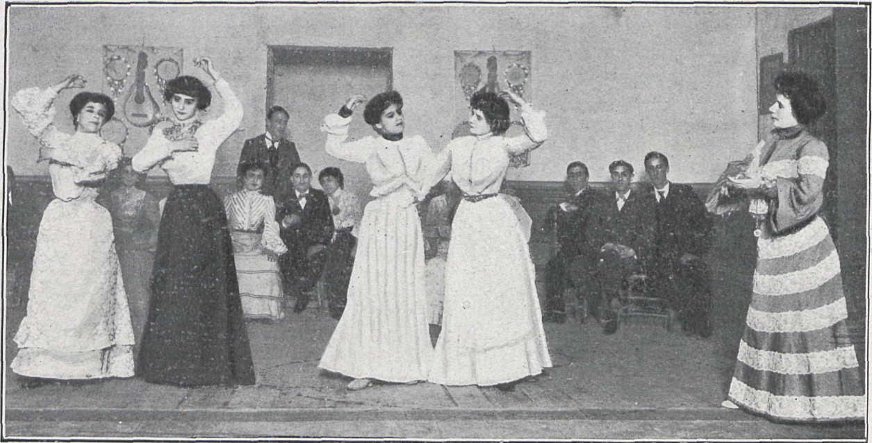
CUADRO TERCERO. — ACADEMIA DE BAILE DE LA CAMARONA