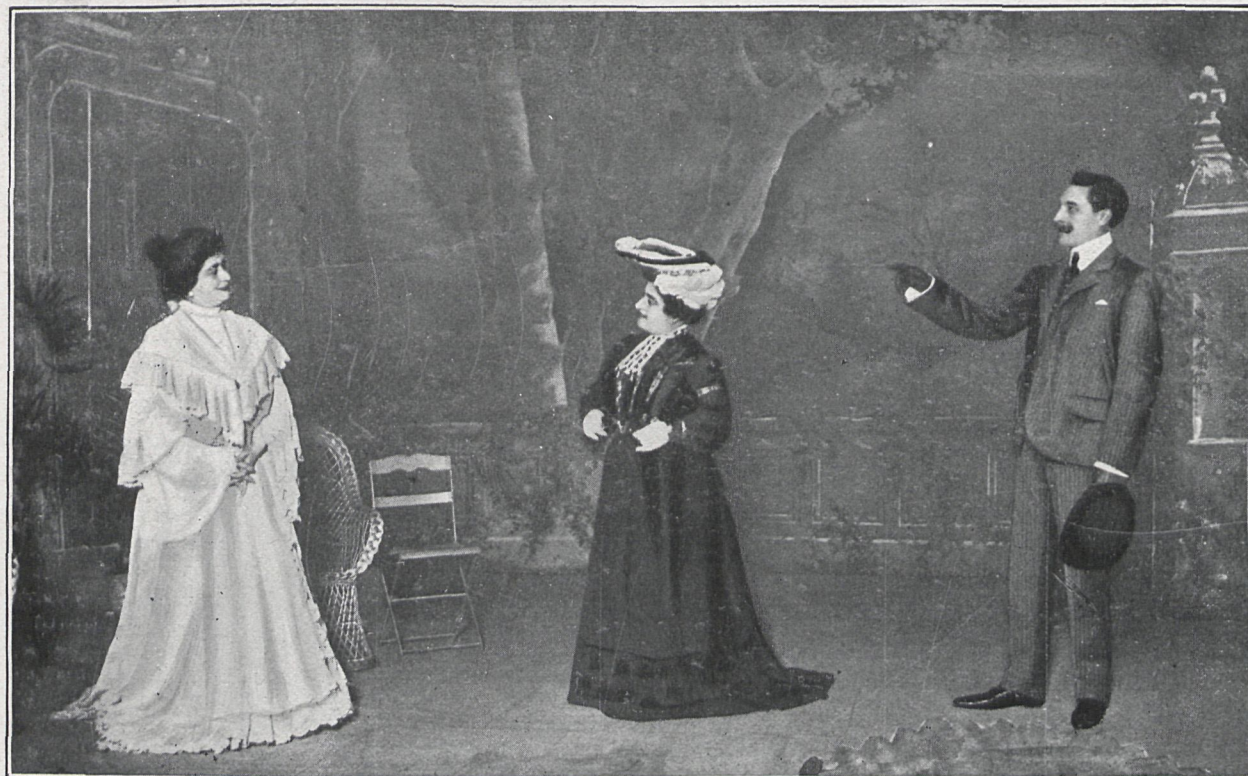
ACTO TERCERO.—TERESA, Sra. Tubau .—SRA. DE LA BANDIERE, Sra. Estrada .—GASTÓN, Sr. González .

medios de vida, al descubrir la doble traición de su esposo, que determina la ruina de su fortuna y de sus sentimientos de esposa, decidiéndola á entablar demanda de divorcio.