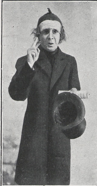
EN «EL PROFESOR DE MÚSICA»