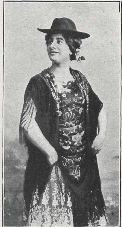
EN «EL MORRONGO»