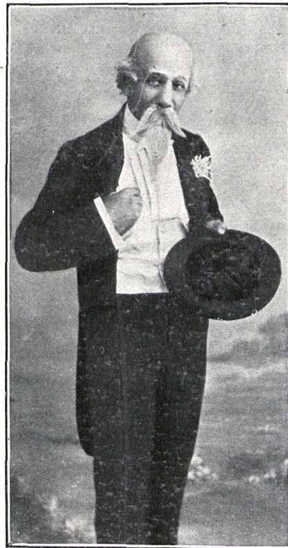
EL GENERAL LOBO EN «VIDA GALANTE»