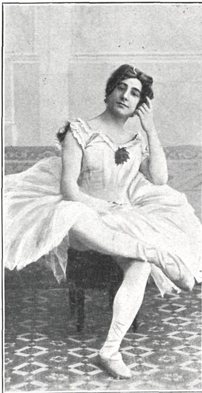
EN «LA BAILARINA DEL FAUSTO»