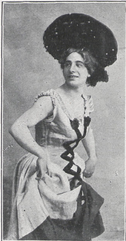
EN «CONCURSO ARTÍSTICO»

En la noche del 14 del actual estrenó un á propósito titulado Vida Galante , escrito por el aplau-