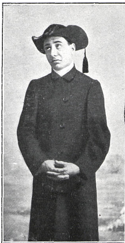
EN «COSSO FA Ó CREVETTE...»