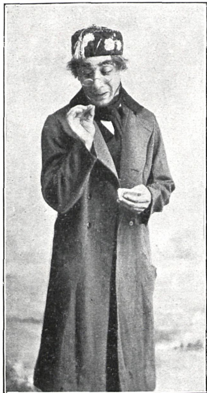
EL APUNTADOR EN «LA BAILARINA DEL FAUSTO»

Terminado su contrato con la empresa del Cómicó, el distinguido artista ha salido para Bilbao.