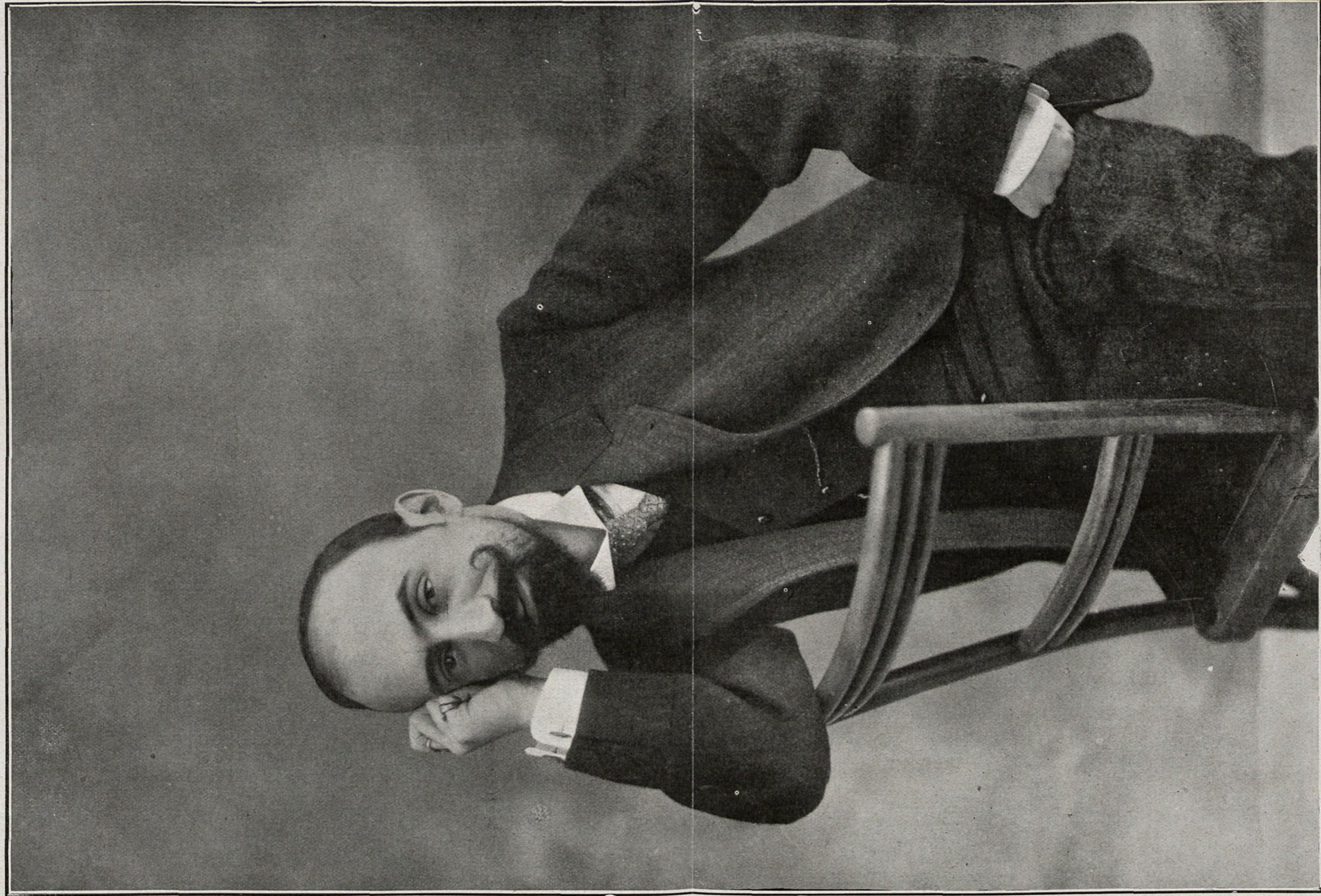
JACINTO BENAVENTE, autor dramático