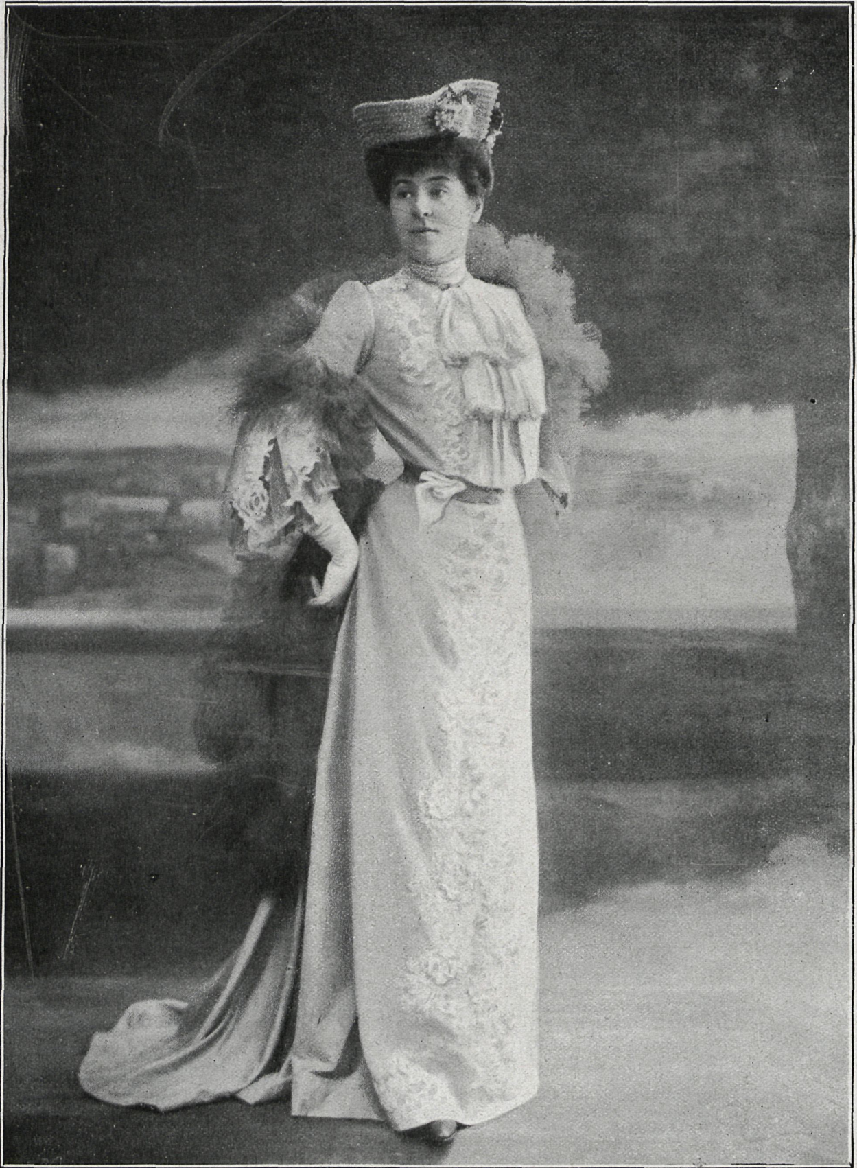
LA EMINENTE ACTRIZ DE LA COMEDIA FRANCESA, MLE BARTET, QUE HA DADO DOS REPRESENTACIONES EN EL TEATRO DE LA ZARZUELA, OBTENIENDO UN GRAN ÉXITO