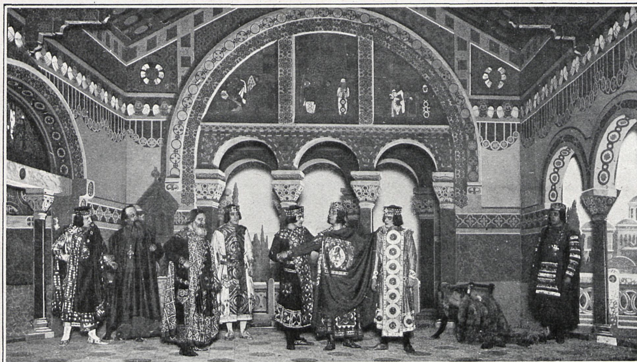
«ANDRÓNICA». —UNA ESCENA DEL PRIMER CUADRO DEL ACTO SEGUNDO