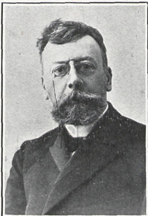
D. ANGEL GUIMERÁ Autor de la obra

Tal vez fuera más útil estudiar, siquiera fuese someramente, las condiciones de tiempo y lugar en que los personajes de la obra se mueven; pero eso tampoco es posible, porque reclamaría mucha extensión, sin dar por ello fruto sazonado y conveniente; nadie ignora el grado de rebajamiento á que llegaron las costumbres en la época y en el país en que Guimerá parece haber colocado la acción de su obra, y pasar de ese conocimiento vulgar, suficiente para comprender la acción de Andrónica , sólo sería posible disponiendo de mucho espacio. Aquí, pues, sólo cabe un relato sucinto y