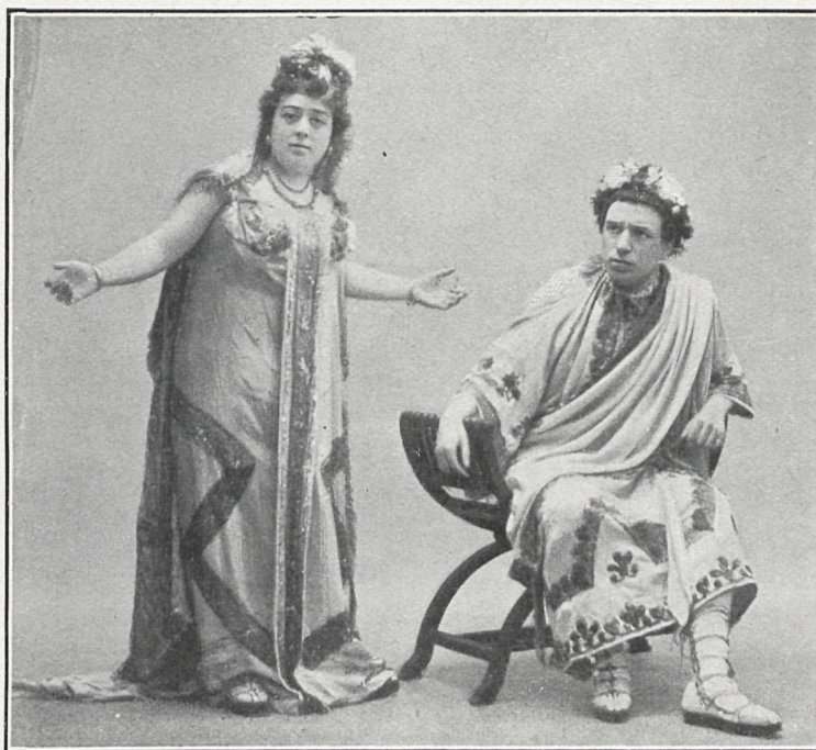
POPEA Sra. Badillo

creyó poder sentirla. Cuando Aulo se presenta, Petronio le significa su gratitud por la conducta que observó con Vinicio, al que cuidó, recogiéndolo en su casa al regresar herido de la guerra. Oyense á lo lejos las risas francas de Ligia y Cayo, el hijo más pequeño de Aulo, que juega con la joven en el jardín. Un momento después aparecen. Petronio contempla absorto á la joven, cuya hermosura le conmueve y á la que saluda y felicita con una frase propia de su fino ingenio. Tras un breve diálogo con Aulo, que Vinicio aprovecha para hablar á Ligia