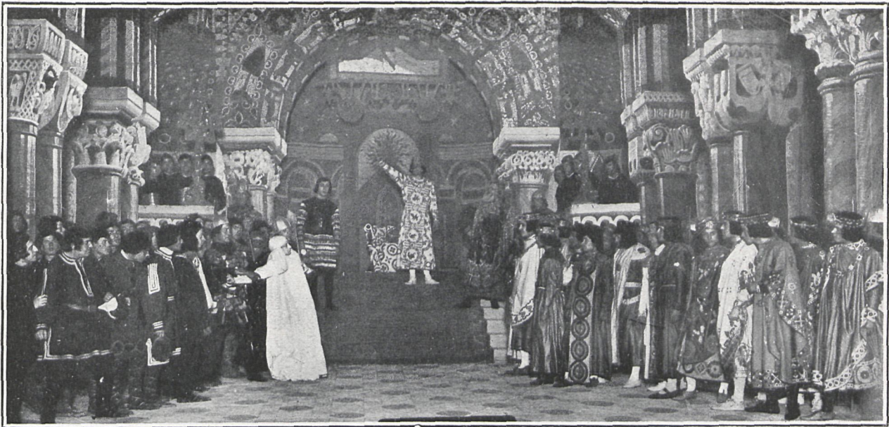
«ANDRÓNICA».—UNA ESCENA DEL PRIMER ACTO