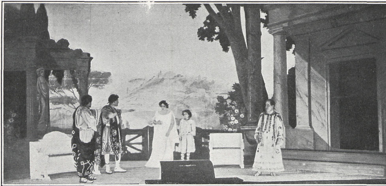
«¿QUO VADIS?».—ACTO PRIMERO.—LA CASA DE AULO