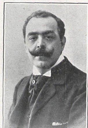
D. LUIS LÓPEZ BALLESTEROS Autor de la traducción

Impresionan á éste la hermosa figura y el sublime valor de la monja, y pide que le dejen solo con ella;