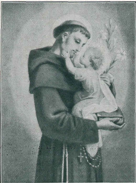
SAN ANTONIO DE PADUA