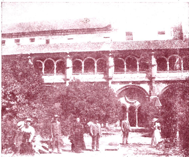
PORTUGAL: MONTECO DE ALCOBACA—EL CLAUSTRO D. ENRIQUE Inst. de F. Viegas.