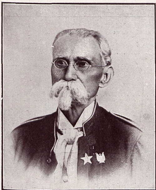
MAXIMO GOMEZ General cubano.