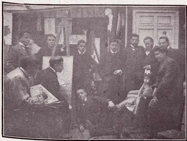
EL CÉLEBRE PINTOR FERRÁN Y SUS DISCÍPULOS EN EL ESTUDIO ] Inst. de Valentin Zubiaurre.