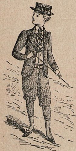
Traje de niño de 8 á 12 años.