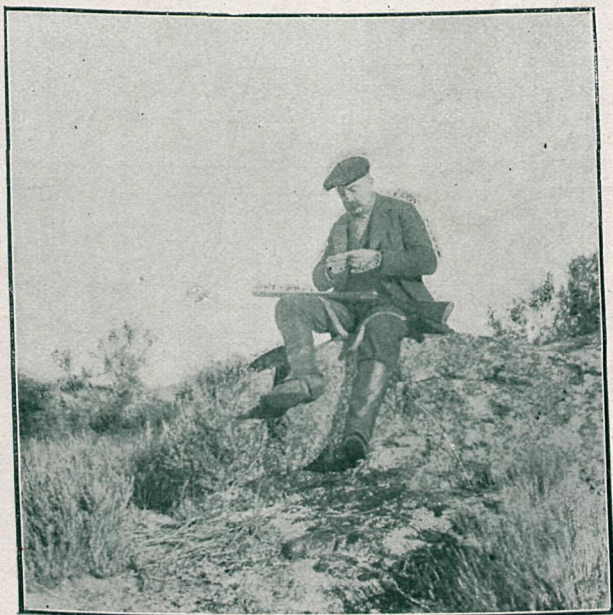
Un alto en la caza, preparando un cigarro. Inst. de Miguel Lazi.