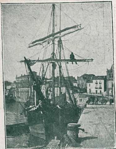
GIJÓN.— Antigua dársena. Inst. de Flor G. Zenkz.