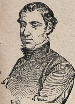
EL GENERAL RIEGO