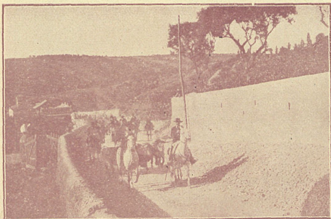
PORTUGAL: Esperando á los toros.