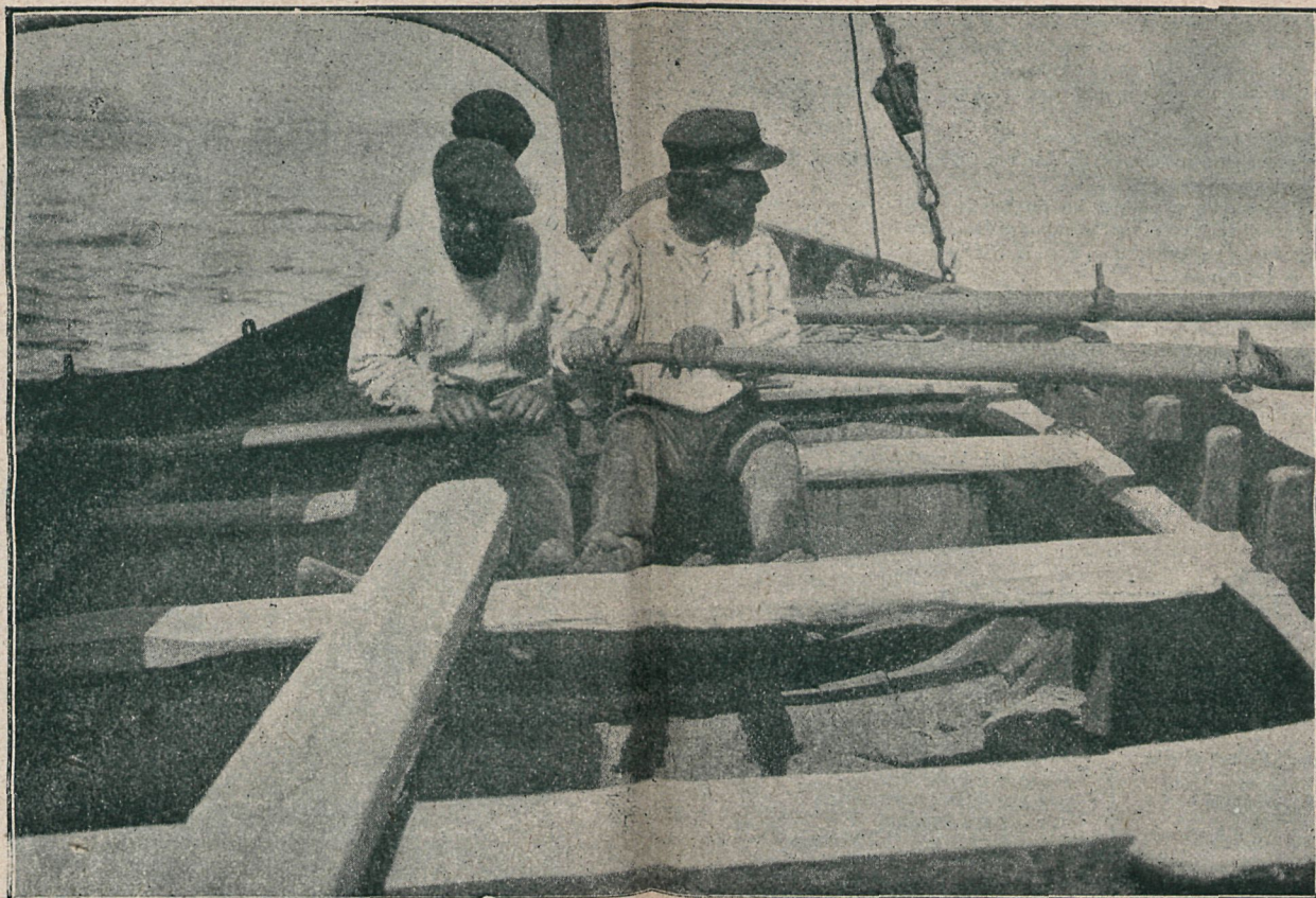
Á VELA Y Á REMOS