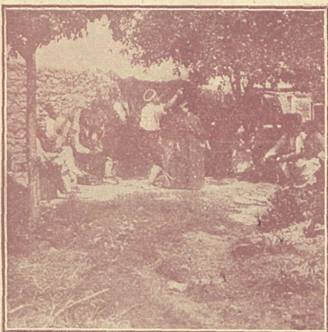
Una boda en Aragón.