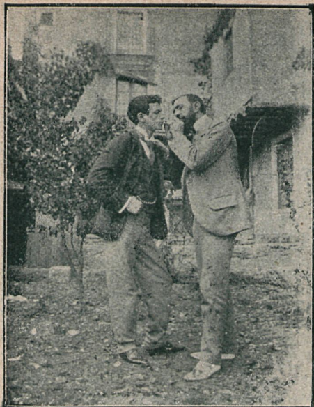
TUDELA: ENCENDIENDO EL CIGARRO