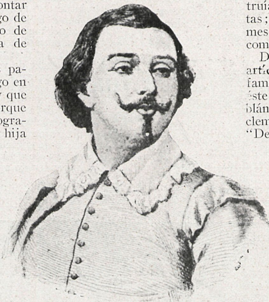
AGUSTÍN DE ROJAS