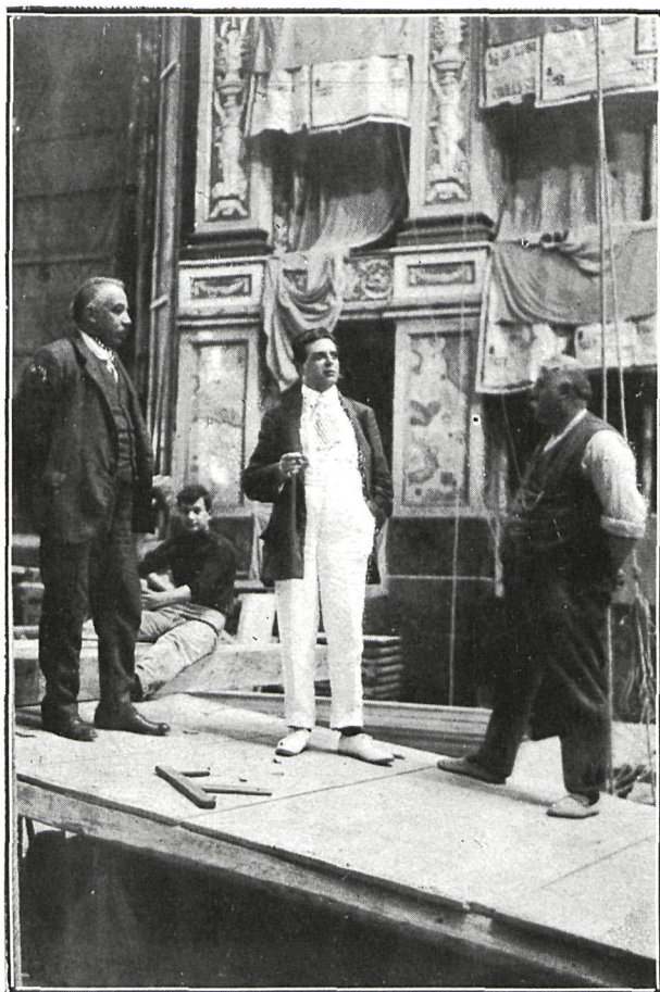
EL MAESTRO MASCAGNI DIRIGIENDO LOS TRABAJOS DE REFORMA DEL TEATRO CONSTANZI, DE ROMA

La dirección del Constanzi ocupa, casi sin descanso, á Mascagni, que está satisfechísimo por haber reunido una orquesta admirable. Sin embar-