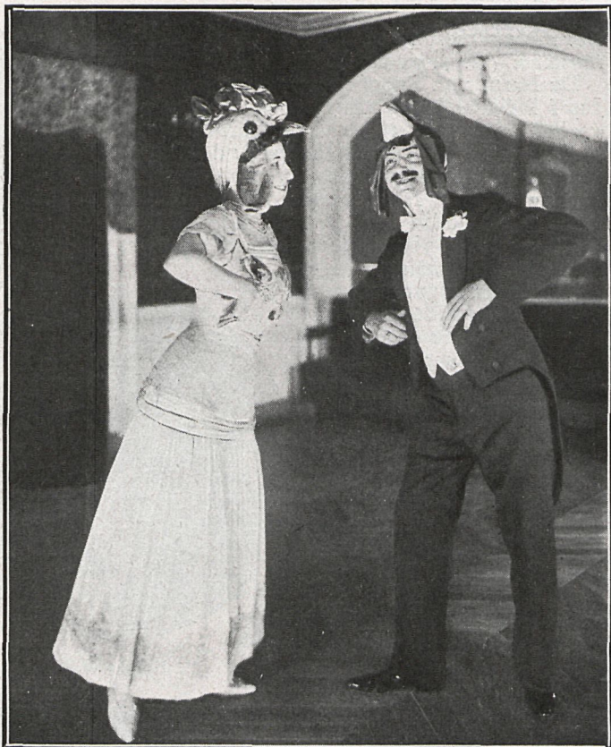
Primera figura de «Le Chanteclerette».

En la figura tercera, la gallina, sugestio- nada por el gallo, da los mismos pasos que éste. En la cuarta, el bailarín persigue á su pareja, y así sucesivamente hasta que los dos "ahuecan el ala", como diría cual- quier danzante del arroyo Abroñigal.