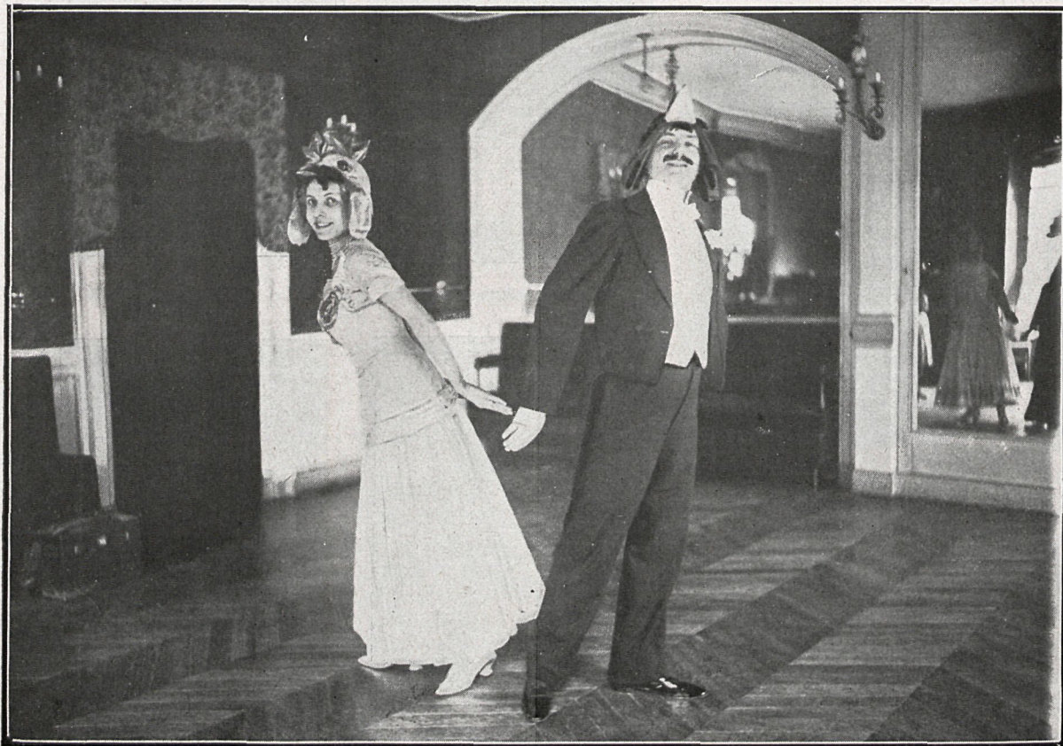
Tercera figura de «Le Chanteclerette».