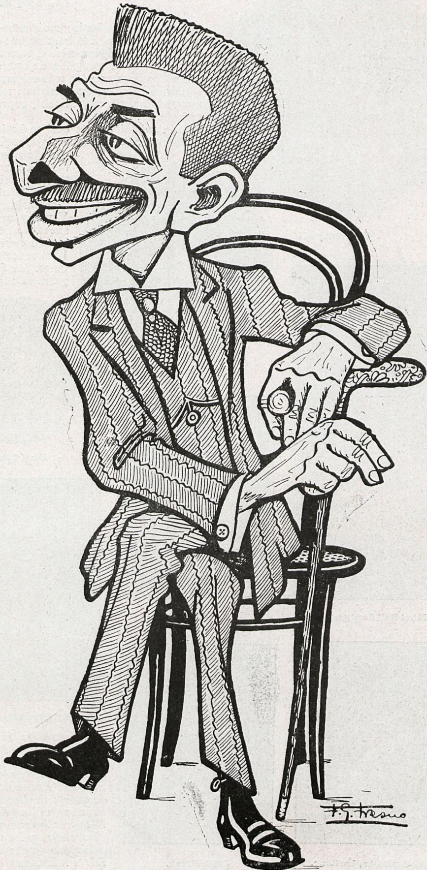
ACTORES ESPAÑOLES MARIANO LARRA