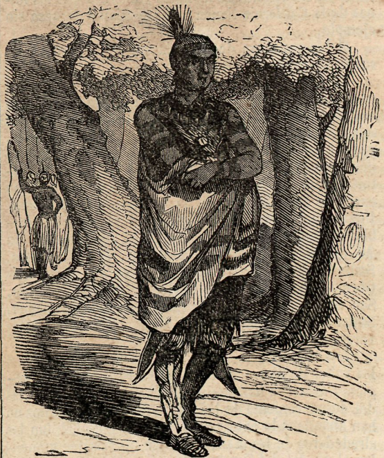
Ge'fe indio de la America Septentrional.

Desde el mes de agosto de 1848 la presencia del oro fué señalada en una vasta estension de terreno. «La region aurifera se ensancha de dia en dia, escribia entonces M. Walter Colton, alcalde de Monterey. Se ha encontrado una cantidad considerable de oro en el Sacramento, la Horca Americana, brazo Norte y Sur, el rio de la Pluma, Iva-River y el Consumnas, como tambien en las cumbres de muchas colinas. El pais en que se ha demostrado la presencia del oro no