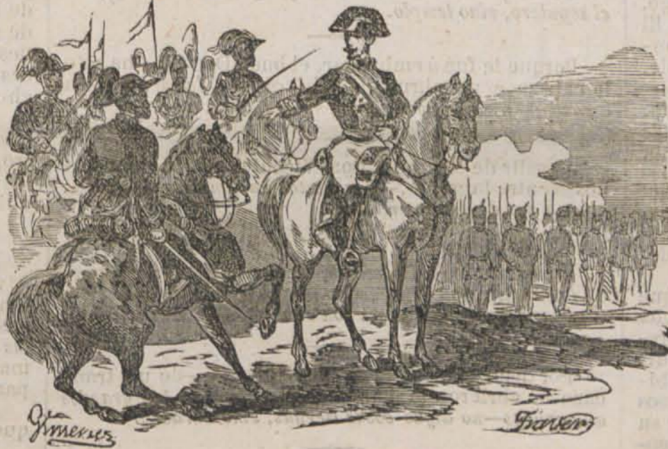
General y su Estado mayor.