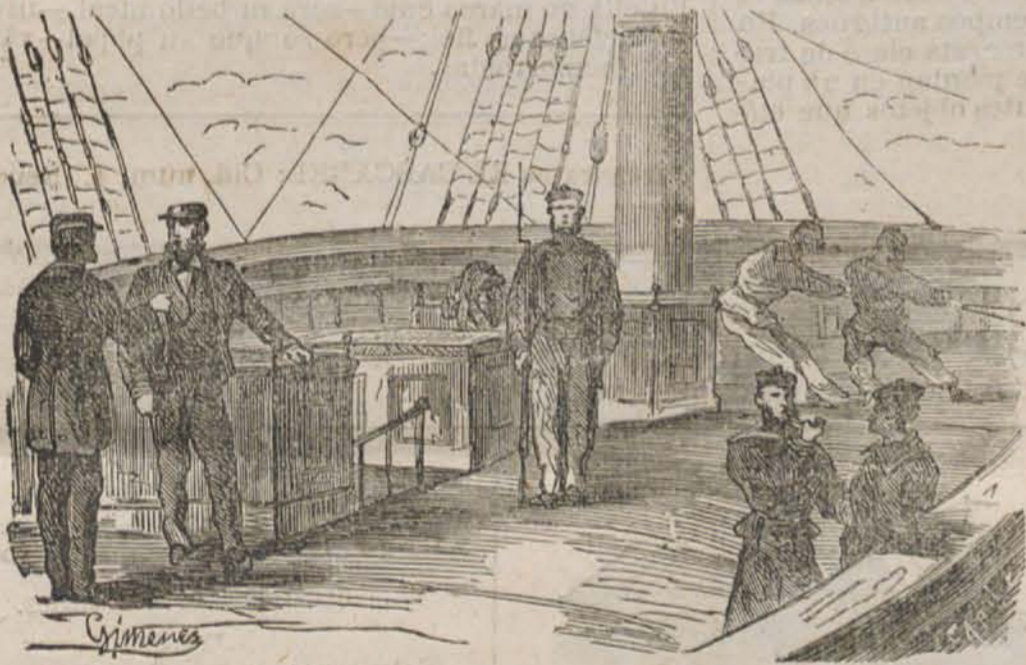
Estado Mayor de Artillería.—Condestables.