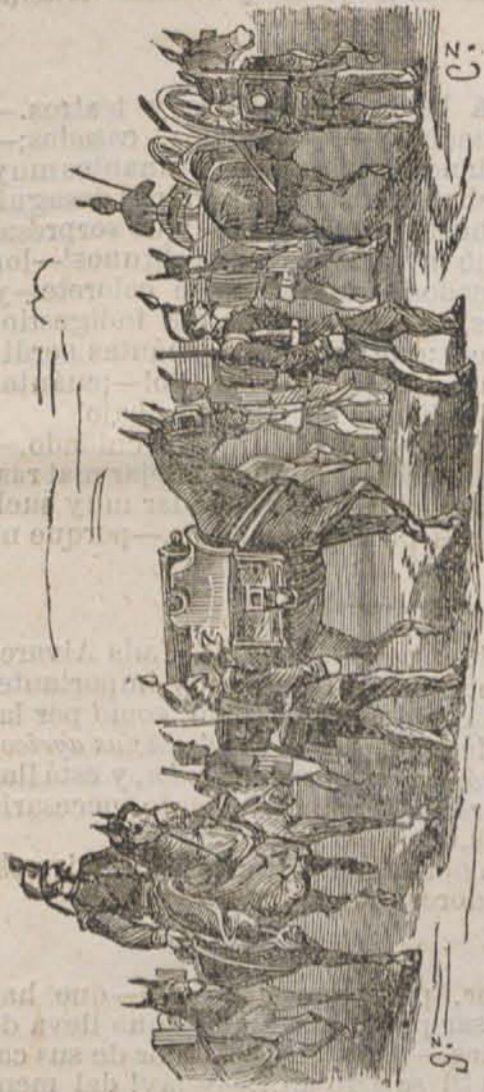
Artillería de montaña.