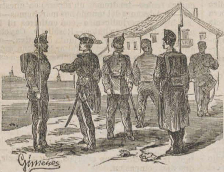
Infantería de Marina.