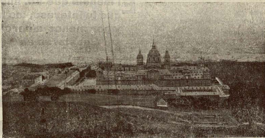
Una vista de nuestro admirable Monasterio, que estos días está siendo objeto de nutridas visitas, por numerosos turistas extranjeros y nacionales