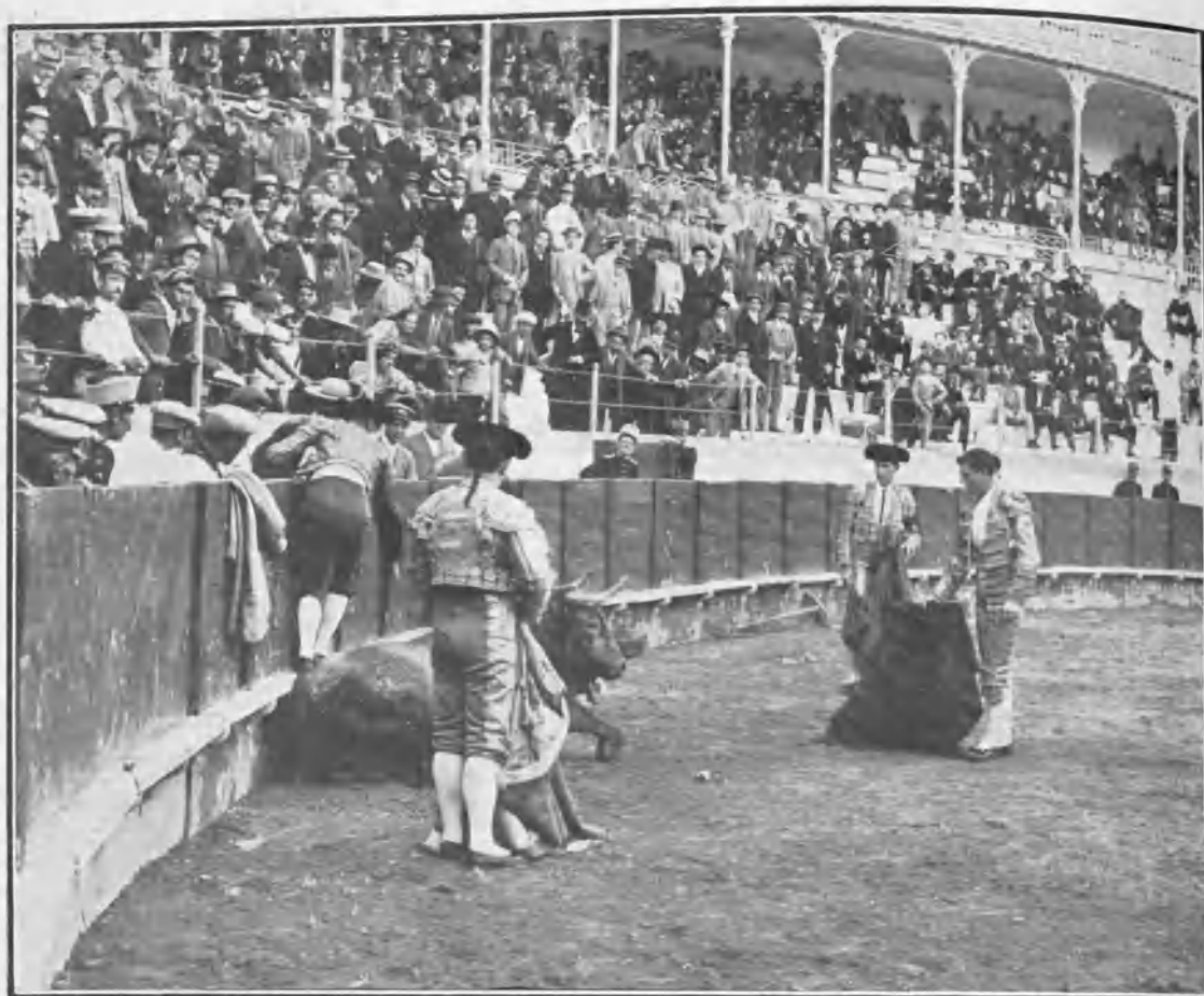
«Manolete» viendo doblar á su segundo.