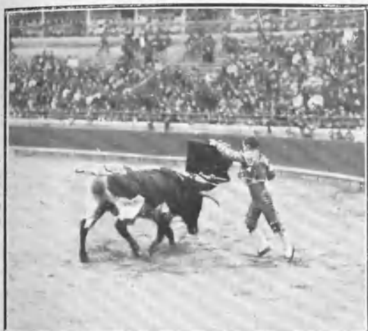
«Gordet» muleteando á su primer toro.