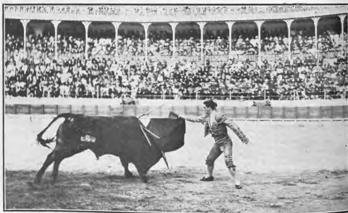
«Machaquito» pasando de muleta.