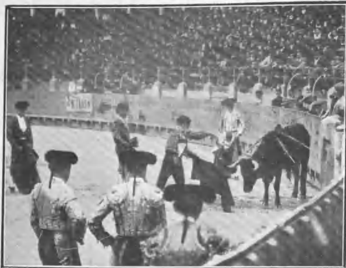
«Lolo» descabellando a su primero.

ro y vió ir á los corrales al último, que no merecía los honores de ser muerto en plaza.