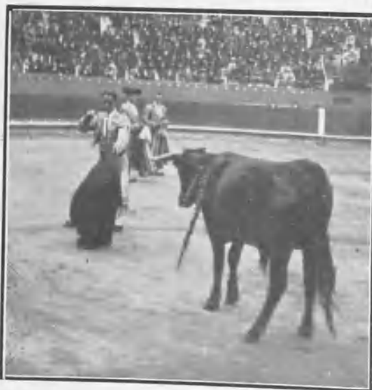
Palma de Mallorca. Ugarte perfilado ante su primero.