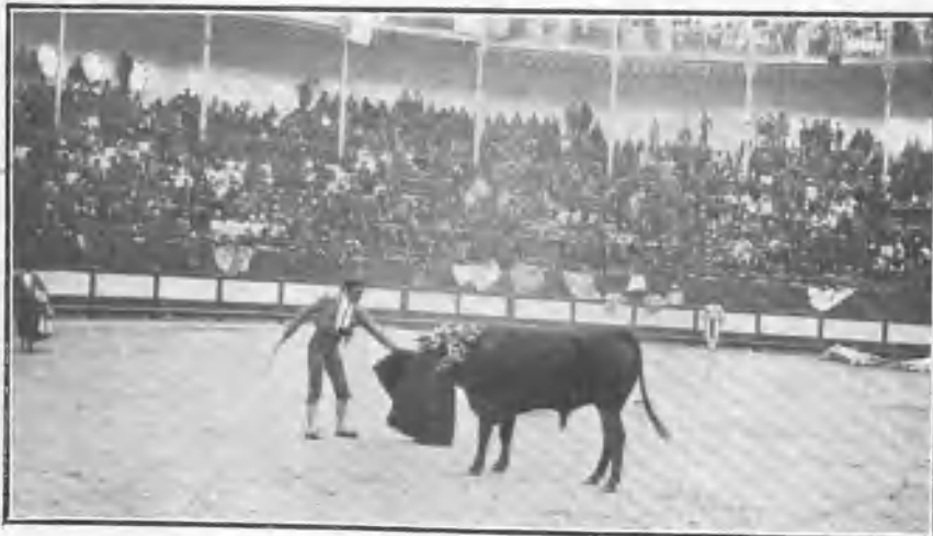
«Machaquito» pasando de muleta al tercer torero.