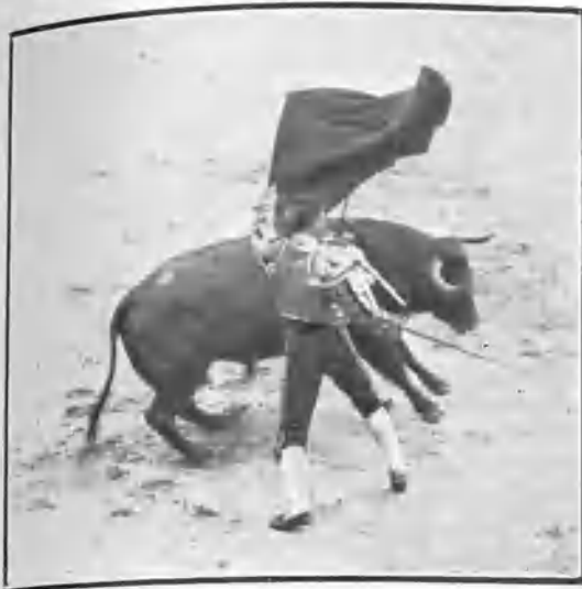
«Machaquito» pasando de muleta.

En un achuchón, al querer descabellar, se sintió del brazo lesionado en Valencia y se retiró á la enfermería, después de escuchar una desagradable bronca.