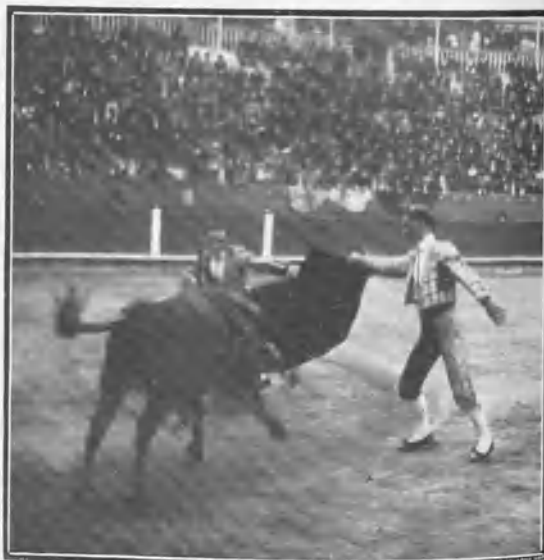
Palma de Mallorca. Ugarte pasando de muleta á su tercer toro.