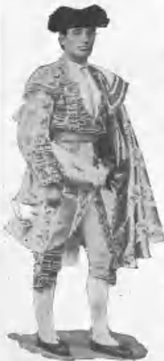
Rafael Molina (Lagartijo).