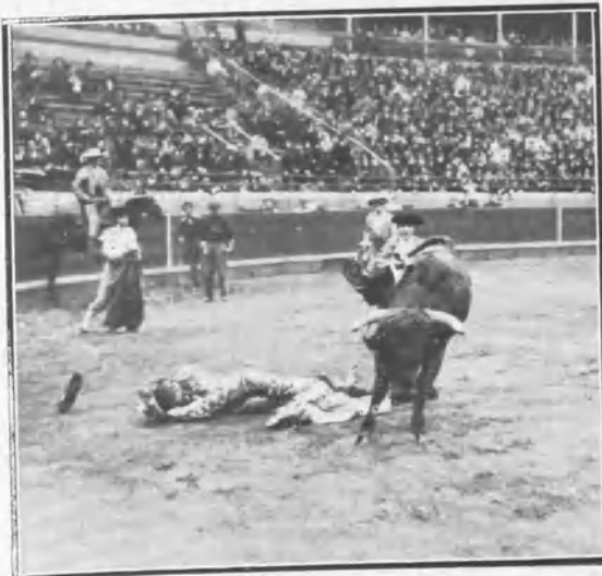
Cogida de Alé por el tercer toro.