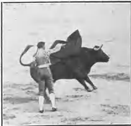
«Cocherito de Bilbao» pasando de muleta.

Patatero , Cantimplas y Vito bregaron muy bien; estos mismos, el Barquero , Blanquet y Camará clavaron excelentes pares; el mejor puyazo correspondió á Ceniza , y estuvieron buenos Zurito , Melones y Chano .