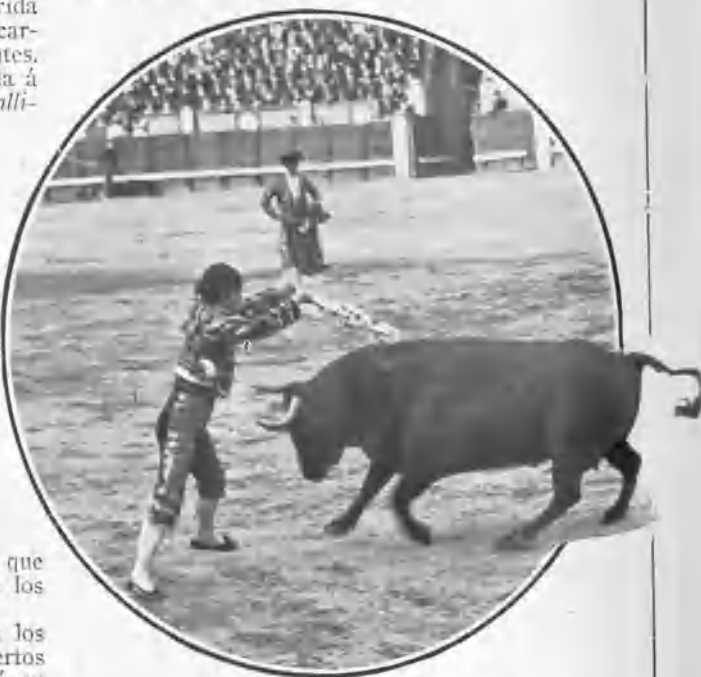
«Machaquito» poniendo un par.

El cuarto tuvo poder y fué muy tardo en los cuatro puyazos por otros tantos caballos muertos de que se compuso el tercio. Salinero acabó su vida quedado.