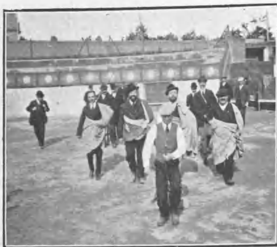
Paseo de las cuadrillas.