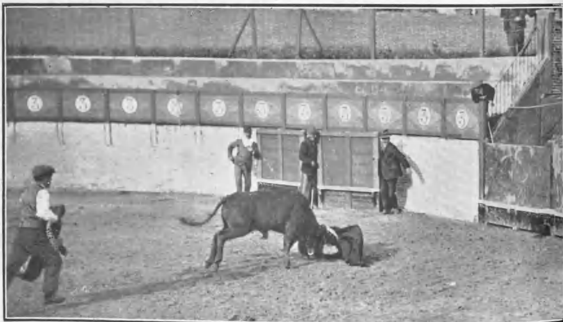
Un crítico por los suelos.

La fiesta, en conjunto, fué agradabilísima, y de las que no se olvidan fácilmente.