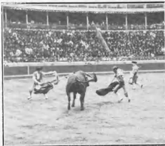
Alé pasando de muleta.