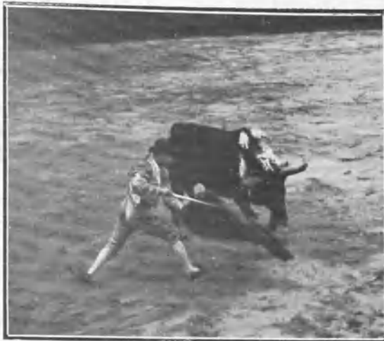
«Bienvenida» toreando de muleta.