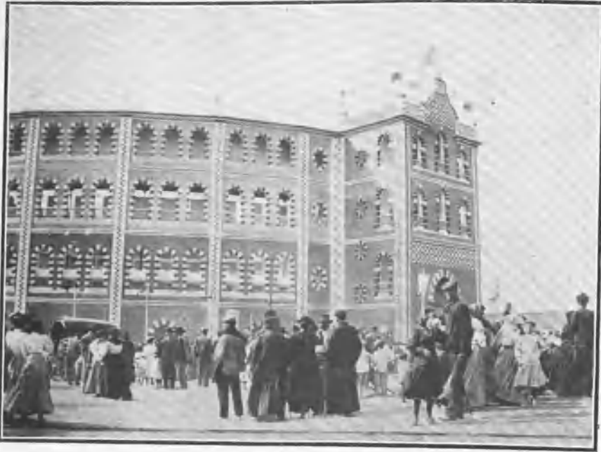
Exterior de la plaza de toros.

a en el número anterior dimos cuenta de haberse inaugurado la nueva plaza de toros de Caudete con una corrida á todo lujo, en la que fué una lástima que no torease Bombita , como estaba anunciado, pues así se habría cumplido el excelente programa que para estrenarla habían confeccionado en el importante pueblo de la provincia de Albacete.