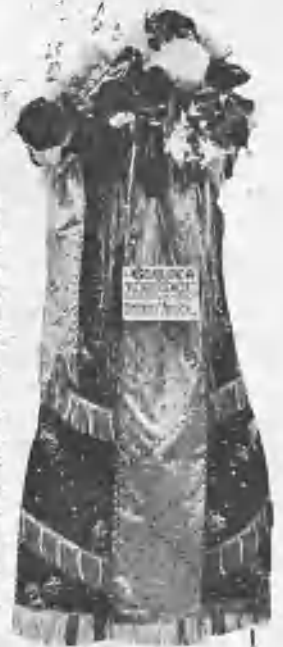
MOÑA REGALO DE LA DIPUTACIÓN

que tan alta puso en otros tiempos la divisa encarnada y blanca. El primero fué muy flojo y se salió suelto siempre en los cinco puyazos que tomó para dar tres porrazos. El cuarto sólo tomó dos varas en regla y las otras cuatro de refilón y con las salidas tapadas. Derribó dos veces y mató un caballo. El quinto fué bravo en dos varas, á las que acometió bien, y aflojó después, pues aunque Chano le pegó en la última, ya se había