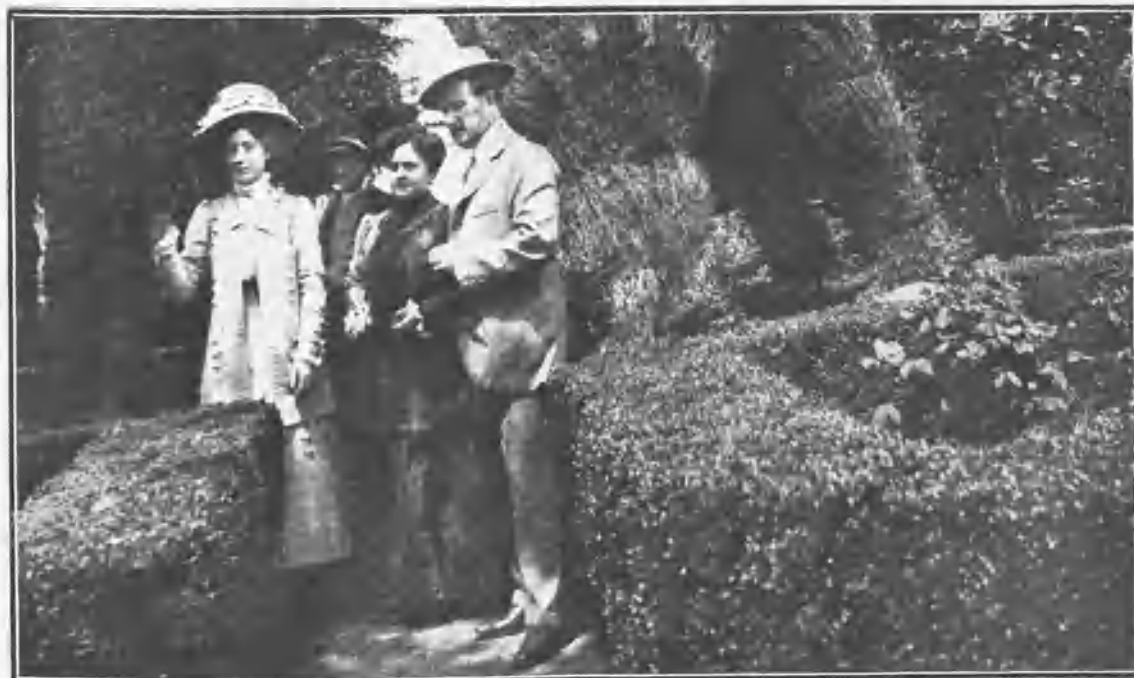
UNA FOTOGRAFÍA ÍTIMA DE LAGARTIJILLO CON SU FAMILIA