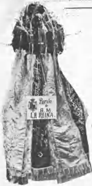
MOÑA REGALO DE S. M. LA REINA

ciones de lidia. En aquella parte, que también es muy esencial para el buen conjunto, dejó bastante que desear, y ha tenido hasta la desgracia de que le desechen uno por inadmisibile. Habíamos oído decir que este aristocrático ganadero ponía gran cuidado en la presentación de sus reses; pero eso no lo hemos visto por ninguna parte. En cambio, en lo que toca á la bravura hay que descubrirse y saludar con entusiasmo