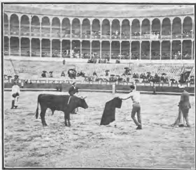
UNO DE LOS ESTUDIANTES TOREROS MATANDO UN BECERRO