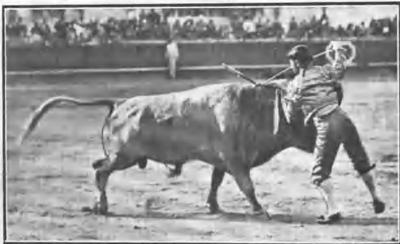
PUNTERET ENTRANDO Á MATAR Á SU PRIMER TORO

El Alcalareño resultó ser de los diestros que tienen al público en un ¡ay! constantemente. Al dar media estocada al sexto novillo fue cogido y tuvo que pasar á la enfermería con varias heridas graves.