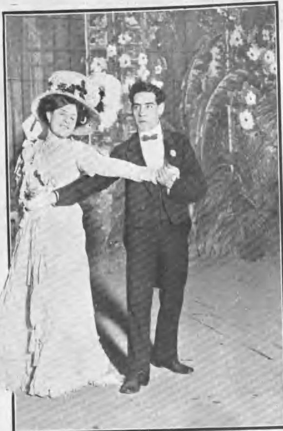
GRAN TEATRO. UNA ESCENA DE VERA VIOLETA