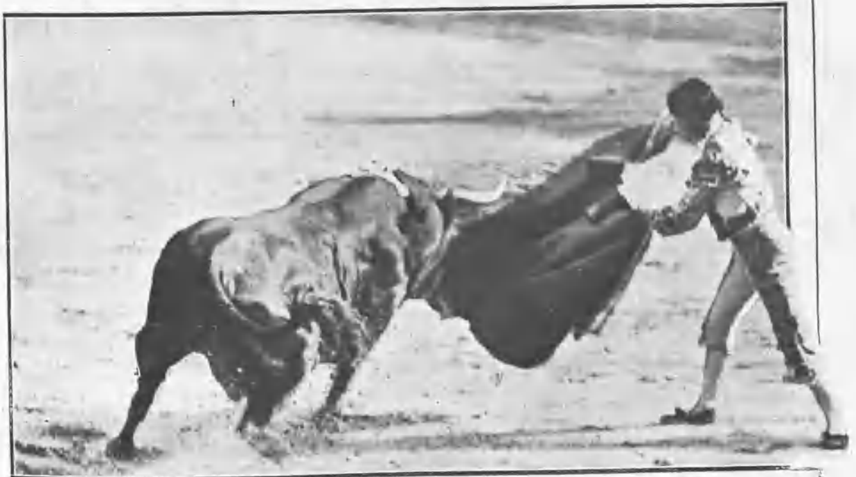
BOMBITA TOREANDO DE CAPA