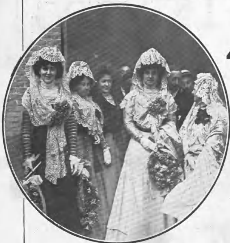
PRESIDENTAS DE LA BECERRADA