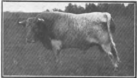
RANCHERO, BERRENDO EN JABONERO