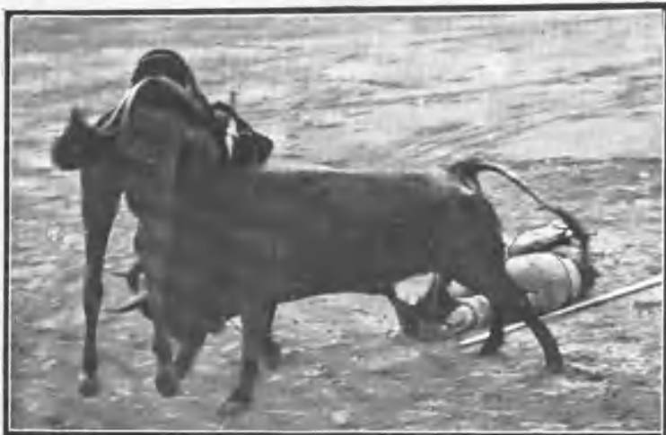
UNA CAÍDA AL DESCUBIERTO

En el de Veragua estuvo muy mediano. Verdad es que el toro no valía nada; pero él tiró á salir del paso y no bien, y se hartó de pinchar, siempre con