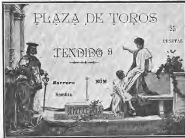
FACSIMILE DE LOS BILLETES DE LA CORRIDA

que tan alta puso en otros tiempos la divisa encarnada y blanca. El primero fué muy flojo y se salió suelto siempre en los cinco puyazos que tomó para dar tres porrazos. El cuarto sólo tomó dos varas en regla y las otras cuatro de refilón y con las salidas tapadas. Derribó dos veces y mató un caballo. El quinto fué bravo en dos varas, á las que acometió bien, y aflojó después, pues aunque Chano le pegó en la última, ya se había