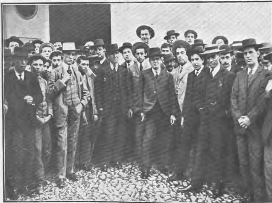
EN EL ENTIERRO DE CERRAJILLAS. LA PRESIDENCIA DEL DUELO 1, Mojino II. 2, Conejito. 3, Conejito Chico. 4, Melones. 5, Lagartijo.

Cerrajillas figuraba actualmente en la cuadrilla de Lagartijo , y contaba con la estimación de todos sus compañeros. Descanse en paz.