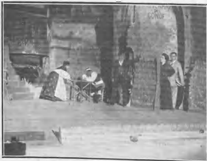
ZARZUELA. PENÚLTIMA ESCENA DE LA TAJADERA