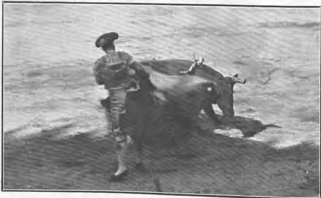
COCHERITO DE BILBAO Á LA TERMINACIÓN DE UN QUITE