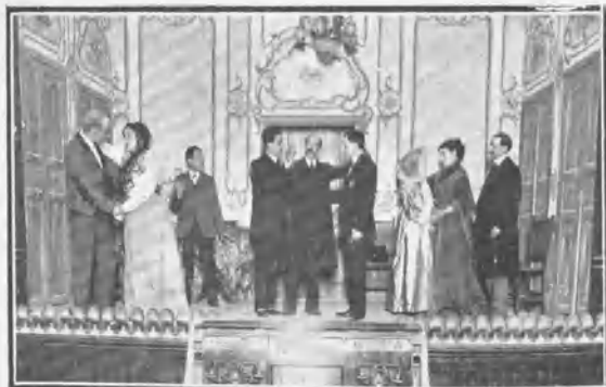
COLISEO IMPERIAL. UNA ESCENA DE AZUL Y ROJA

Semana feliz para los autores que han llevado sus obras á las escenas madrileñas ha sido la que acaba de transcurrir. Todas las producciones estrenadas han tenido muy feliz éxito, y en el Cómico Perrín y Palacios y el maestro Jiménez; en el Gran Teatro Benito Alfaro con su acertado arreglo de Vera Violeta ; en Rómulo el inspirado escritor Sr. Toro y Luna; en el Coliseo Im-