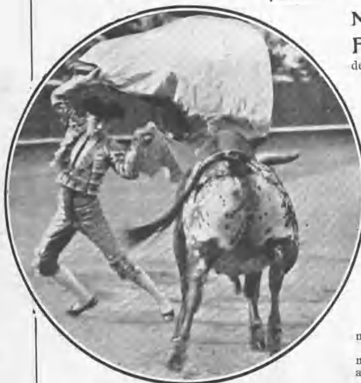
PAZOS EN UN FAROL AL TORO QUE ROMPIÓ PLAZA

Punteret muleteó al segundo novillo admirablemente, y lo mató de media estocada en las mismas agujas, por lo cual se ganó una ovación. En el