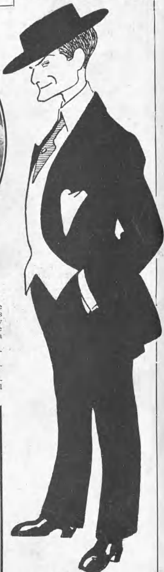
GALERIA DE LOS TOROS RICARDO TORRES (BOMBITA) CARICATURA, POR FRESNO