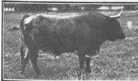
CARARROSA, CÁRDENO, BRAGAO, SALPICAO