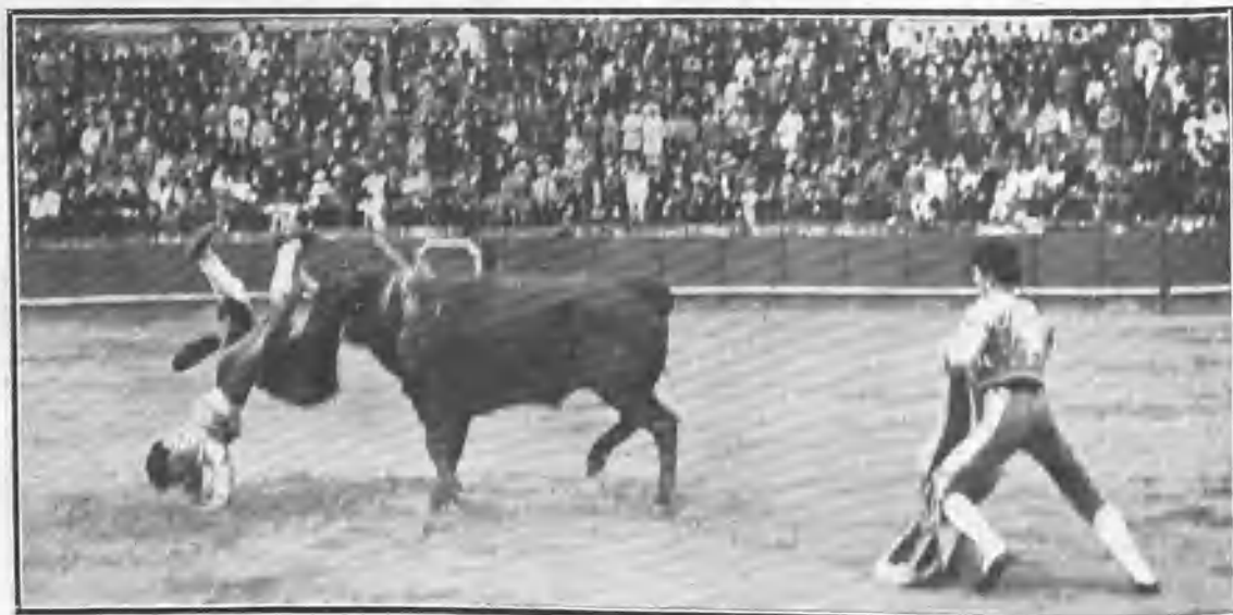
COGIDA DEL ALCALAREÑO AL ENTRAR Á MATAR AL ÚLTIMO TORO DE LA CORRIDA