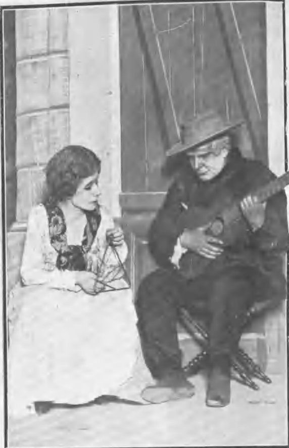
CÓMICO. FINAL DE LAS MIL Y POCO DE NOCHES