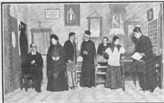
ROMEA. UNA ESCENA DE LA SACHISTIA