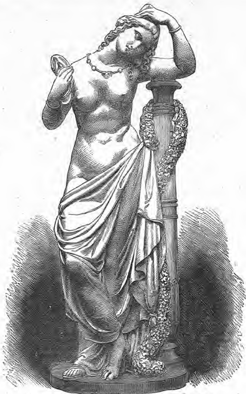
(Estátua de mármol por Gualtero, premiada en la esposicion de Berlin.)

para preparar su pretendida piedra filosofal , cuando fué sorprendido por la policia; dicese que no tuvo tiempo aun de quitarse la mascarilla de vidrio que usaba, y además en el proceso formado por la Inquisición, existe una raminiscencia que dice hábersele hallado tambien unos troqueles y un volante de acuñar moneda; pero esto es una impostura segun las mejores probabilidades. El hecho es que arrestado en un principal, recibió, merced á cierta influencia empleada por su esposa, orden de espulsion perpétua de los estados episcopales. En su virtud, el conde, escoltado por una guardia de caballeria hasta la frontera, se estableció en Vicenza.