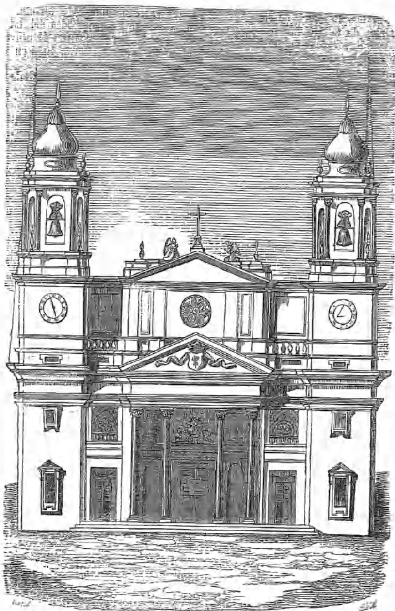
La Catedral de Pamplona.

Hacia el Nordeste de la hermosa capital del antiguo reino de Navarra, y sirviéndole de base los formidables muros de ella, álzase un edificio gigante que cual pigmeos contempla á los que puestos en torno suyo apenas osan acercársele mas que esquivando, por decirlo así, sus miradas. En aquel edificio está la veneranda cátedra de los sucesores del mártir San Fermio, que en el primer siglo del cristianismo la fundó en me-