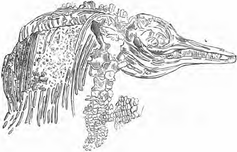
Figura núm. 1. Con efecto, al examinar la construc-

cion de los intestinos del tiburón, se deja ver que la naturaleza á fin de economizar el lugar que este órgano ocupa en el interior de estos animales, quienes en razon de su voracidad deben tenerlo muy desarrollado, le dió la forma espiral. Esta observacion interesante habia sido ya hecha por Locke segun lo demostró por medio de diferentes piezas de la coleccion anatómica de Leyde. Poley ha tratado tambien esta materia con el mejor acierto. «En este animal, dice hablando de una especie de tiburón, el intestino es recto de un extremo al otro, pero este intestino recto y por consecuencia corto, no es en realidad mas que un conducto arrollado en forma de tirabuzón, y tan solo despues de muchas circunvoluciones en la larga carrera que atraviesa la sustancia alimenticia, consigue llegar al punto de salida. En fin, el intestino, siguiendo la lámina en espiral que lo corta en su interior, presenta una estructura análoga al tornillo de Arquímedes. Esto se advierte perfectamente vaciando el intestino de uno de estos pescados en yeso ú otra sustancia aparente, y el molde obtenido por este medio, ademas de su rollo espiral, presenta las impresiones de los pequeños vasos que tejen el órgano. Este rodete arrollado que atraviesa poco á poco en el intestino grande,