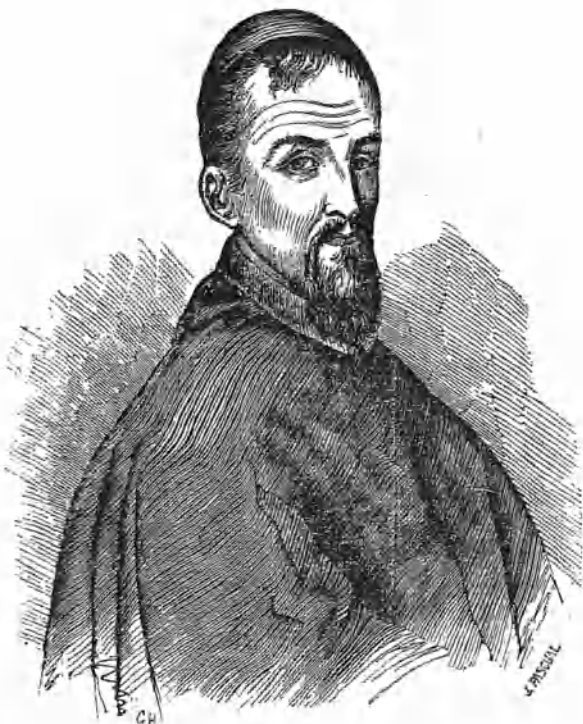
J. Card. Belluga