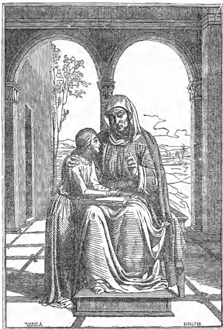
(Santa Ana dando lección á Nuestra Señora.—Cuadro de D. Joaquin Espalter.)

Hay cierta crítica impertinente, que se halla siempre dispuesta á condenar al ostracismo cualquiera obra por bella que sea, siempre que no cuadre enteramente con el sistema de quien la usa. Los que guiados por un espíritu exclusivo, no saben considerar al arte sino bajo un solo punto de vista, el materialismo , reprochan incesantemente á los de la escuela contraria un defecto, en el cual mas que otro alguno acostumbro á incurrir un gran pintor, cuyo nombre jamás dejan en paz sus labios. Es este defecto el de los