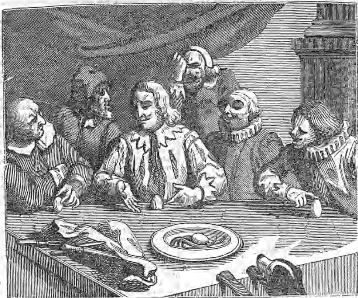
UNA ANECDOTA DE CRISTÓBAL COLÓN.

C RISTÓBAL Colón cenaba un día en compañía de varios pedantes; estos, que envidiaban la gloria de aquel grande hombre, quisieron probarle que nada había sido más fácil, que el descubrimiento que acababa de hacer del Nuevo Mundo: Colón nada respondió; dejó girar la conversacion, y preguntó sonriéndose si alguno de sus interlocutores sabía el medio de hacer sostener un huevo de punta sobre la mesa. Al oír esto cada cual separó los platos y mantiles, y tomando huevos se esforzaban en vano afirmándolos con los dedos por ver si encontraban medio de hacerlos sostenerse, hasta que cansados de sus infructuosas diligencias protestaron que era imposible conseguirlo. — "Ahora lo veremos" dijo con gravedad el ilustre navegante, y dando un golpe sobre la mesa con la punta del huevo que tenía en la mano le hizo permanecer derecho sobre ella. — "Eso cualquiera lo hace." — Esclamaron entonces los concurrentes, y Colón se contentó con hacer observar que esta exclamacion es siempre la que se hace despues de las grandes descubrimientos y de las mas importantes empresas cuando todas las dificultades aparecen disipadas delante del genio.