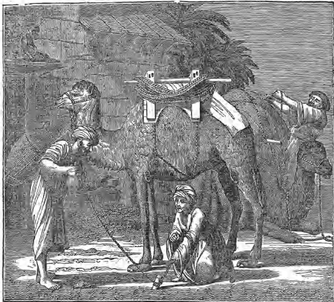
(Modo de cargar el camello árabe.)