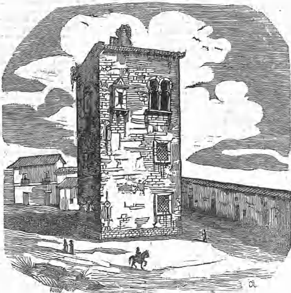
EL CASTILLO DEL CARPIO.

S inco leguas al E. N. E. de Córdoba, en un cerro de mediana elevación, á un tiro de bala de la orilla izquierda del Guadalquivir, está situada la villa del Carpio, que algunos escritores han juzgado que es la Ehora de los romanos á que Plinio llamó cereal. Otros han asegurado que es la Onuba que pone el mismo cerca de Córdoba á la orilla izquierda del Betis; empero otros colocan á Ehora á dos leguas de Bajalance y á una del Carpio hácia el cortijo llamado del trapero, y reducen á Onuba al sitio que ocupan las ventas de Alcolea. Colocando Plinio aquella antigua población á la orilla izquierda del Betis, se echa de ver el error de los que la suponen en el citado parage que ocupa la orilla opuesta. Otros finalmente pretenden que Onuba estuyo donde ahora los Cansinos, sitio distante de Córdoba mas de tres leguas, donde se descubren muchos vestigios de antigüedad. Aunque no sea fácil resolver esta duda en medio de tan diversas opiniones y de la confusión que producen los varios sitios que en este territorio manifi- Segunda serie.—TOMO II.