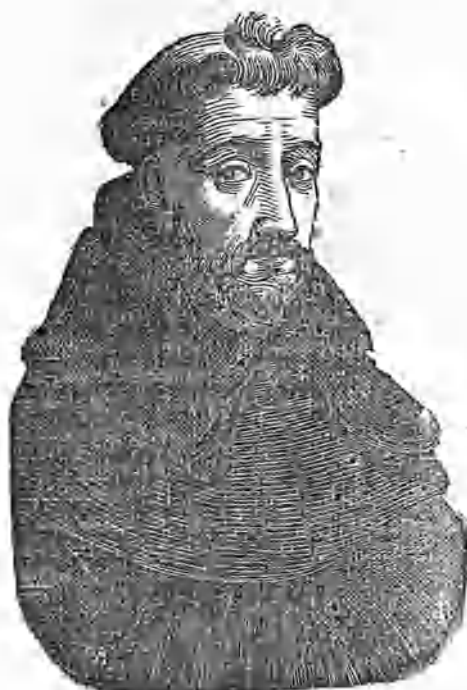
(Fr. Luis de Leon.)

verdadera medida de su fino corazón, es la expresión natural del amor divino y de la fervorosa religiosidad que movieron su pluma en honor de su gerarquía y del catolicismo español hasta el seno del sepulcro. Pero la oda maestra de Leon, la que por los golpes brillantes de la elocuencia poética merece ser grabada en la memoria como verdadero modelo del arte y del buen gusto es la Profezia del Tajo al forzador de la Cava, en la que imitando con ventajas la de Nereo á Paris robador de Helena representa la irrupción de los moros en España, la mar de Berbería cubierta de sus escuadras que desembarcan en el estrecho herculano y el fin de la monarquía goda al sexto día de la sangrienta batalla de las dos bueltas á orillas del Guadalete. El amor de la patria, pasión que puede sola despues de la religion producir el sublime, recalienta todas las estrofas que aun conservan el fuego del sentimiento que las dictó y que llenas de vivas imágenes, de patéticos afectos y de armonía imitativa, arrebatan á la par que deleitan, inspirando eficazmente el interés de tan elevado argumento.