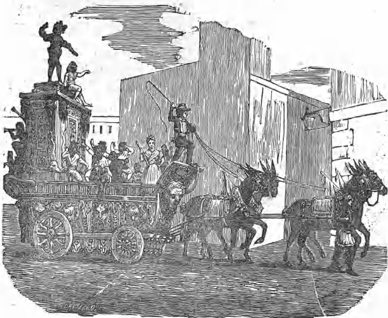
(Una de las Rocas ó carros alegóricos en la Procesion del Corpus.)

Es muy notable la actitud tranquila y al mismo tiempo alegre de toda la poblacion en la solemnidad. Durante los ocho dias se suspenden todos los negocios, y acude una multitud de los pueblos y aldeas circunvecinas, no ocupando á todos mas que una sola idea y asunto, que es ver la procesion; y así es que tanto por esto como por la muchedumbre de individuos que se requieren para la organizacion completa de la procesion, tiene toda esta festividad un carácter verdadero de popularidad, del que no es fácil hallar ejemplo en las solemnidades religiosas, tan frecuentes en las capitales y poblaciones menores de la Peninsula.