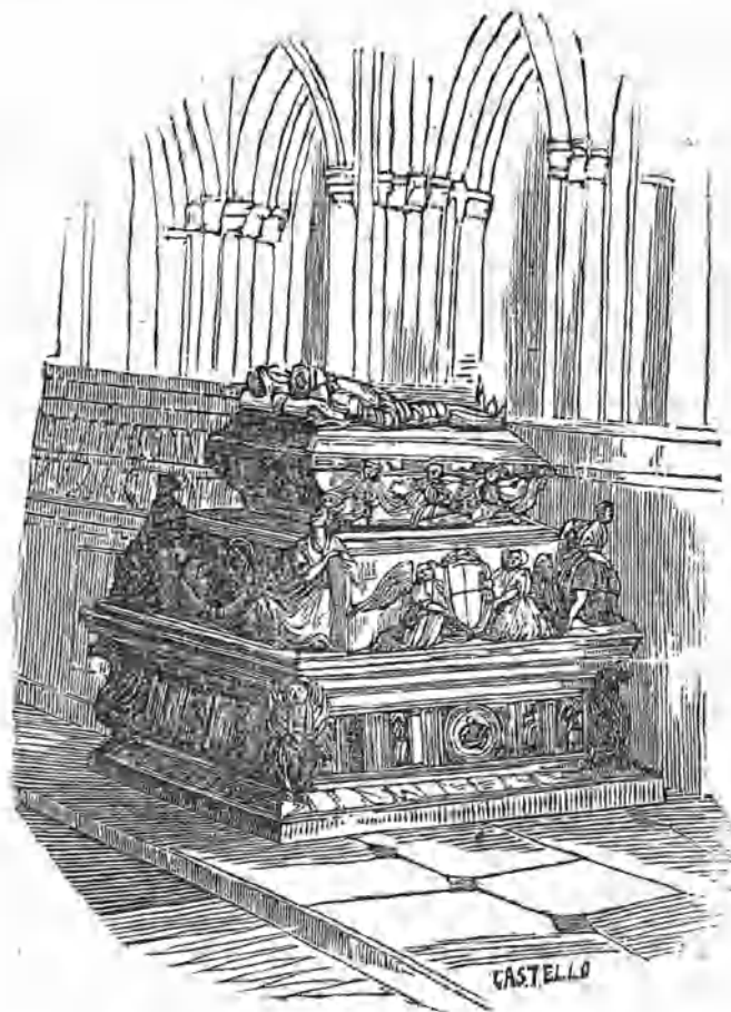
(Sepulcro de los Reyes Católicos, en Granada.)

Sin embargo el celo religioso de Isabel no era ciego ni fanático; y al paso que respetaba á los ministros del altar, sabia cuidar de que no traspasasen los límites debidos. Prueba de ello fueron los clérigos de Trujillo, cuyos excesos contuvo aquella piadosa reina; la chancilleria de Valladolid, cuyos ministros fueron depuestos por haber admitido indebidamente apelaciones á la silla apostólica; la reforma de las órdenes religiosas cuya conducta servia de escándalo; y la anulacion frecuente de provisiones eclesiásticas hechas por la curia romana á quien procuró siempre tener á raya.