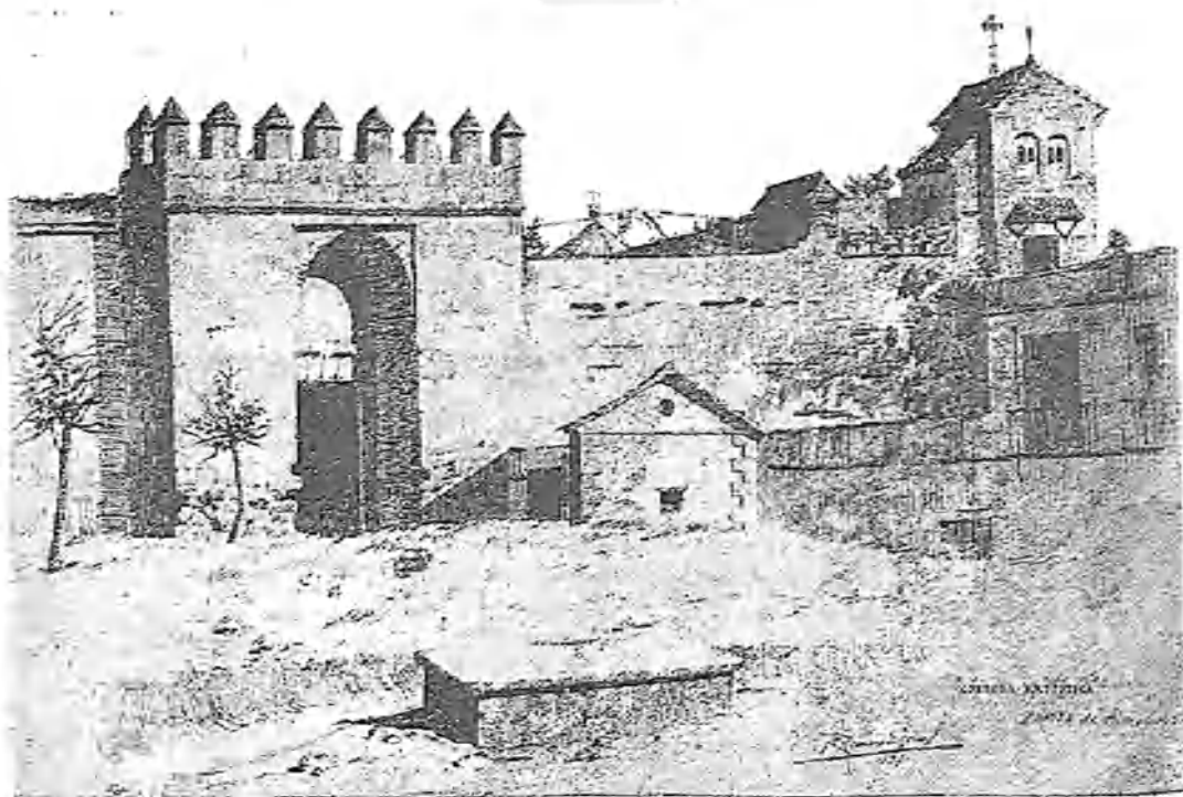
PUERTA DE ALMODOVAR.—APUNTE DE R. ROMERO DE TORRES