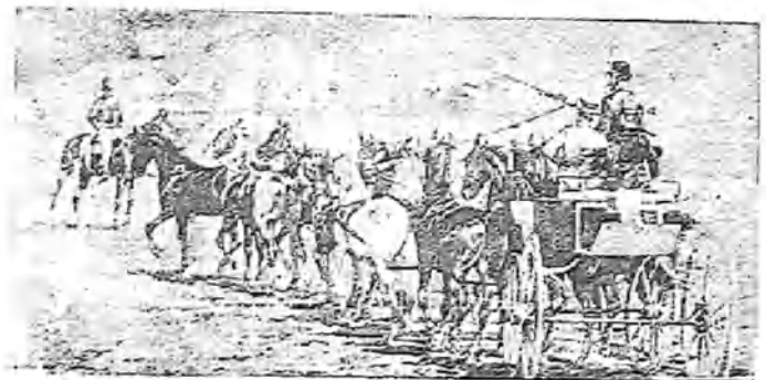
DE VUELTA DE LAS CARRERAS.