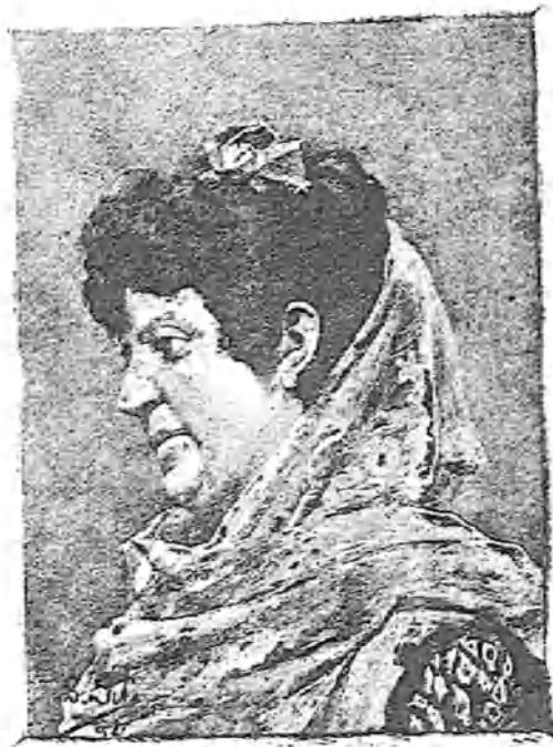
Ilustraciones de E. Gili y J. Romero.