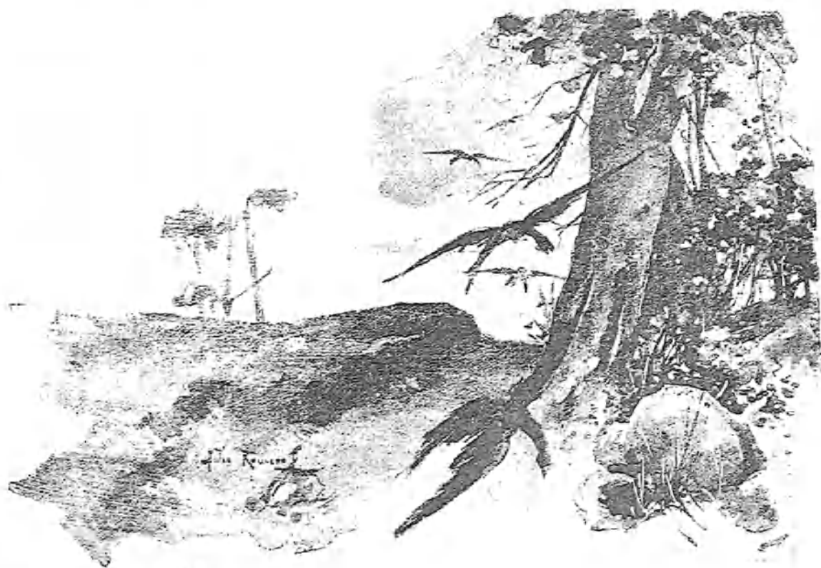
(Ilustraciones de J. Hameró de Torres.)