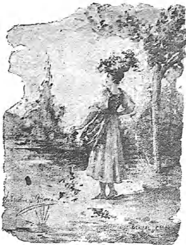
(Instrucción de A. Escobar.)