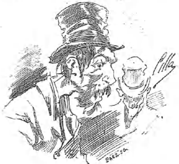
¡OH, EL POTAJE!

—¡Pero, señor, de qué se reirán, si hasta ahora sólo he dicho que «Se necesitan por todos conceptos, evitar la influencia directa!...»