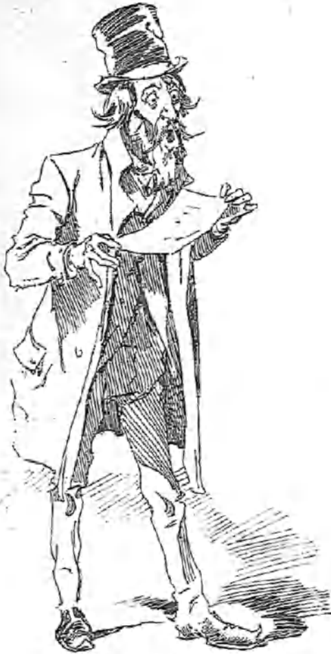
UN GENIO ESCONDIDO

—Ahora, con motivo de los sucesos de Cuba, podía yo leer (si quisieran oírme) esta oda, que empieza: