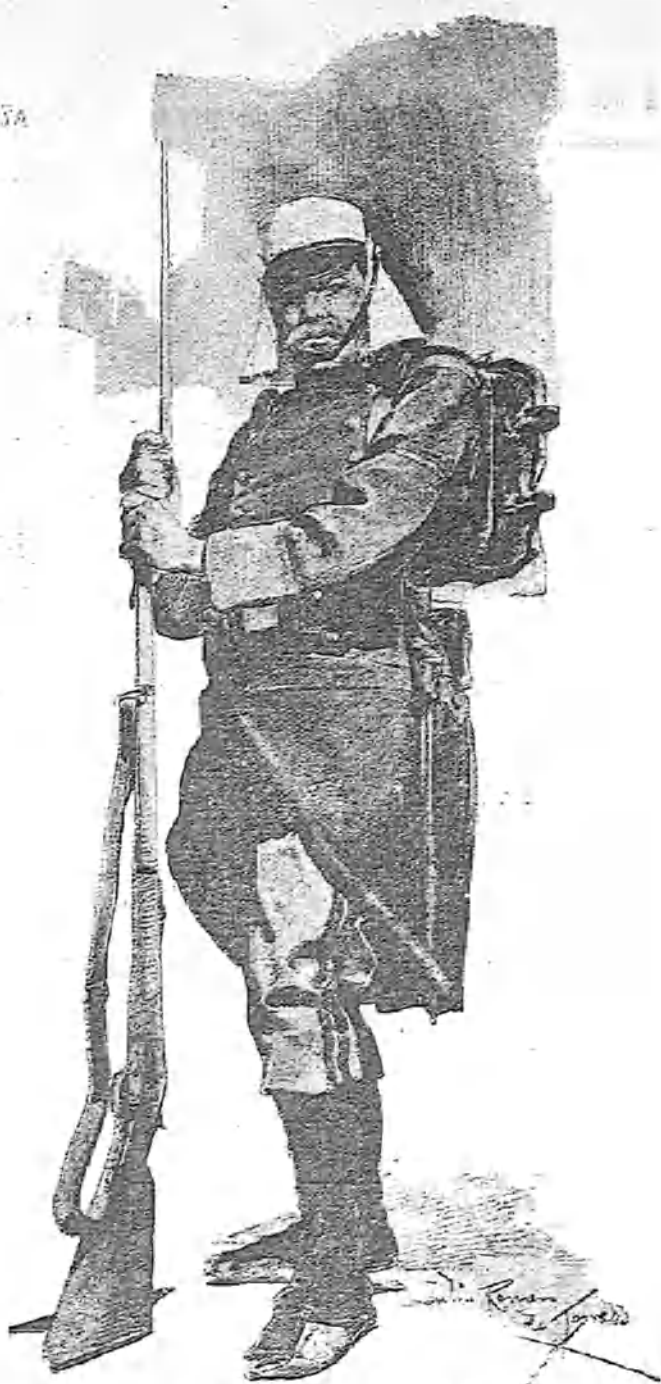
UN VOLUNTARIO PARA CUBA DIBUJO DE JULIO ROMERO DE TORRES

Se pasa la vida, se pasa esperando, y, por fin, si algo llega, es el duro cruel desengaño.