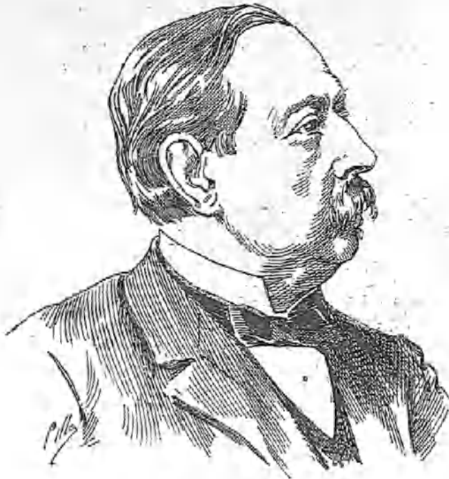
D. MANUEL RUIZ ZORRILLA

La plazoleta frontera á la puerta de entrada y desde la explanada toda que rodea el edificio, se descubren panoramas de incomparable belleza: á la derecha, el mar en una vasta extensión, desde las aguas de Altea hasta Alicante; á la izquierda, el pinar de Villajoyosa, Cabezón de Oro y sus estribaciones de aspecto abrupto, y al frente de la quinta, Villajoyosa, su hermosa huerta sembrada de caseríos, y al término del horizonte, Aitana, la más elevada sierra del reino de Valencia, Pach campana que se distingue por su gentileza, la Cortina y Serra Chelada.