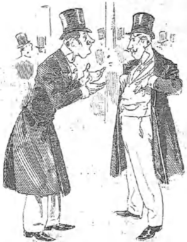
EN EL ENTREACTO

Cruzando el mar alevé y proceloso, marchó Colón el año no sé cuántos, y su pecho viril é impetuoso entró mil penas y diez mil quebrantos.