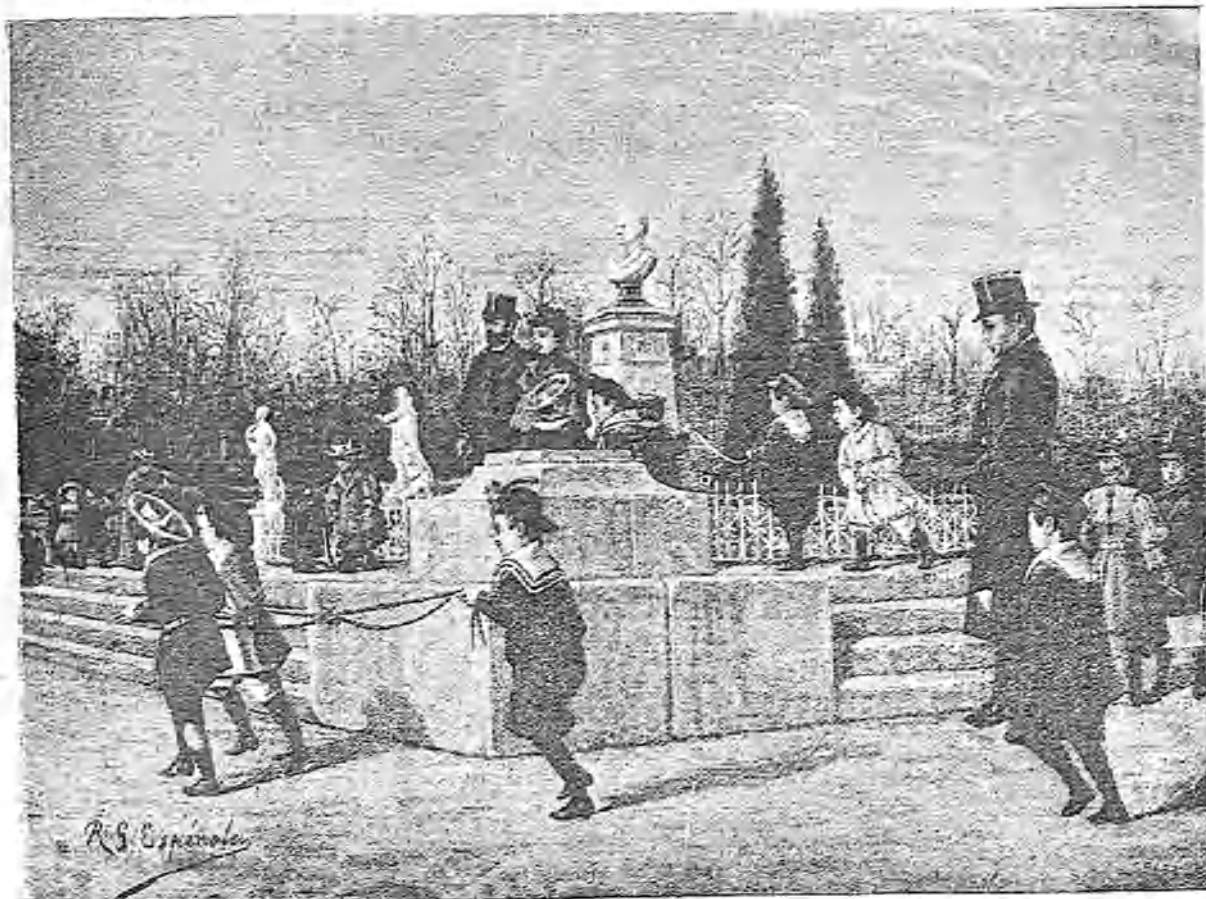
EN EL PARTERRE.—COMPOSICIÓN Y DIBUJO DE R. G. ESPÍNOLA