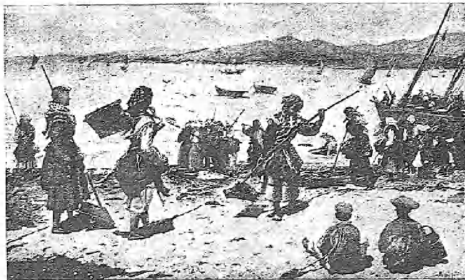
RÍA DE VIGO