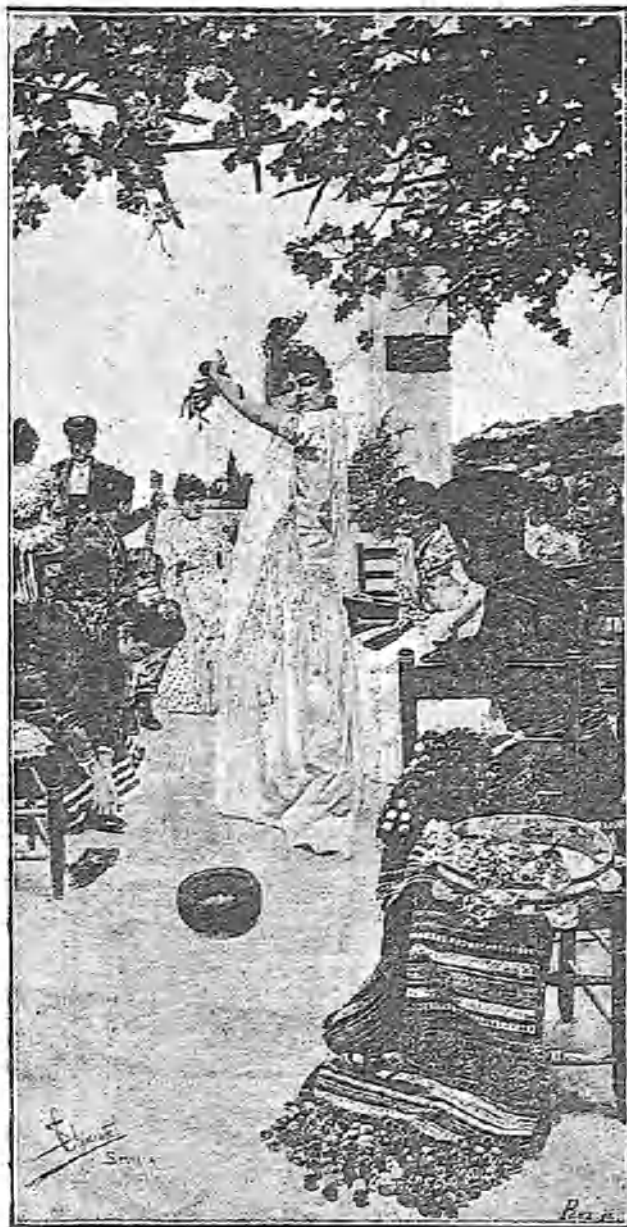
(Ilustración de Salgado Clemente.)

Cual si fuesen sus brazos dos aspas que el viento impeliere, de su cuerpo siguiendo las curvas dan miles de vueltas; mas apenas se anuncian del tango las notas postreras,