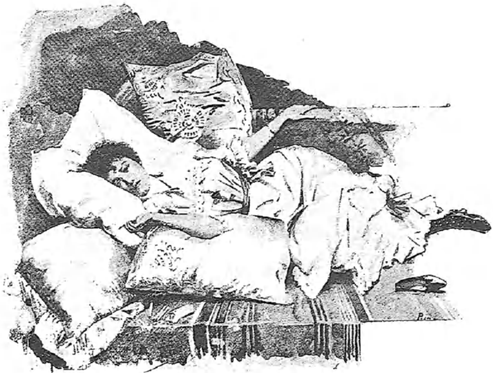
DURMIENDO LA SIESTA