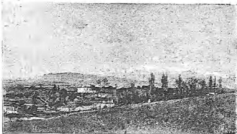
VISTA DEL GUADARRAMA DESDE LA MONCLOA