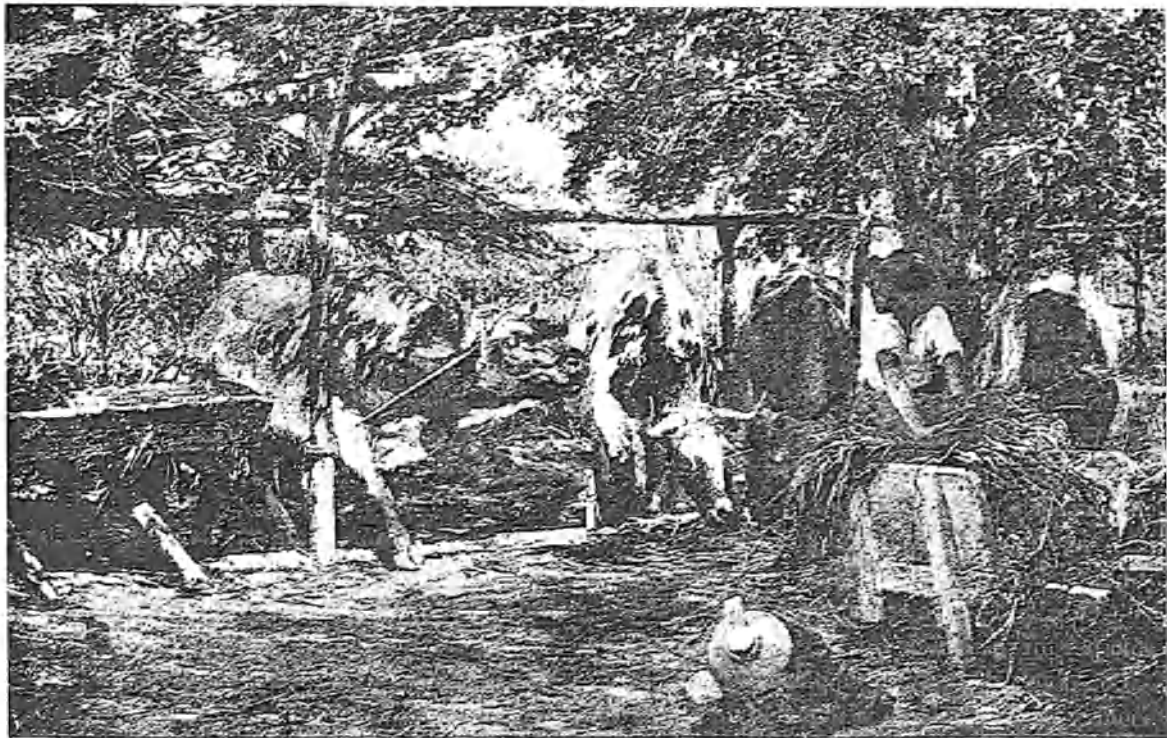
UN SOBRAJO DE VACAS