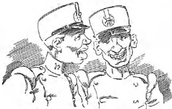
—Has oído como le he dicho a esa ¡cuerpo gueno! —Si somos atroces los de tropa.