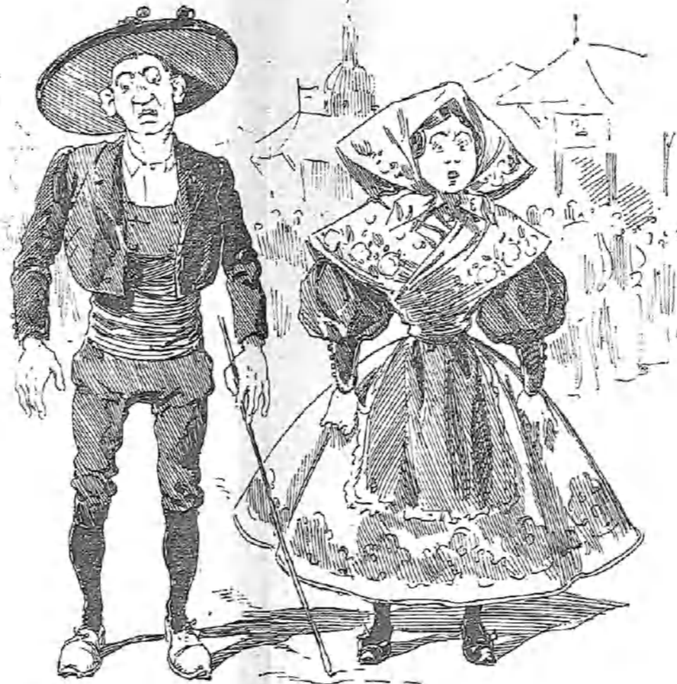
Hace dos años que nos casamos y los dos años hemos venido a la fiesta del Santo, y los dos años, nada más llega me han cambiado todo el dinero que traía por unos cartuchos de perdigones. ¡Miste que tiene eso que well!