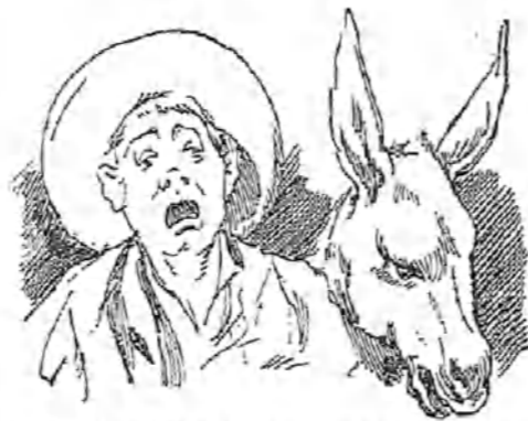
—Ni éste ni yo habíamos venido nunca al Santo; pero no nos ha chocado, ¡je verdad!....