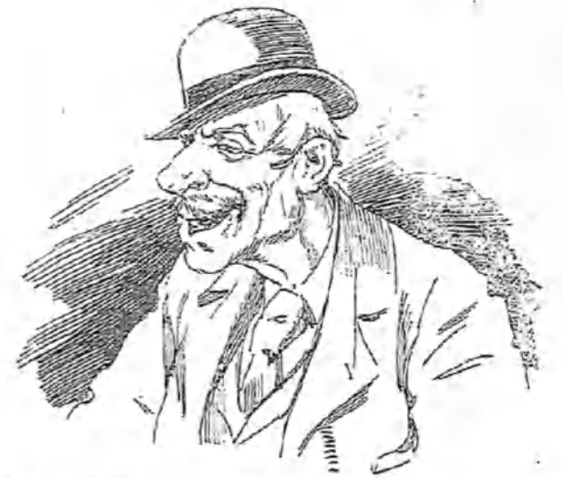
No pasan los años por mí; en cuanto me veo en la pradera, me empieza a bullir la sangre, y estoy viendo que hago alguna diablureja de las más.