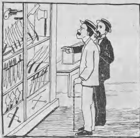
En la Exposición de industrias.

— Ahí tienes expuestos varios cuchillos para degollar señoras, algunas ganzúas y otros varios instrumentos de trabajo. — ¿Y cómo se llama este pabellón? — El pabellón nacional.