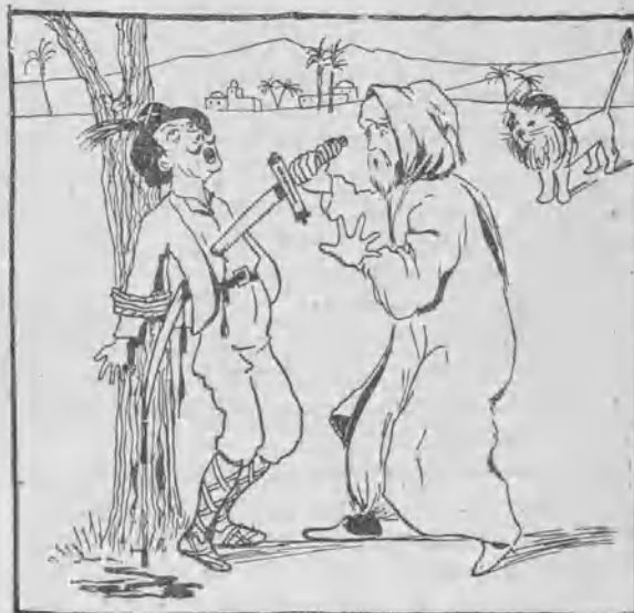
Los últimos sucesos.

— Oye, niño; tú verás inaugurarse la mondonguería municipal, el cementerio de Sánchez Toca y.... si vives muchos años, puede que alcances a ver el indulto de Nakens.