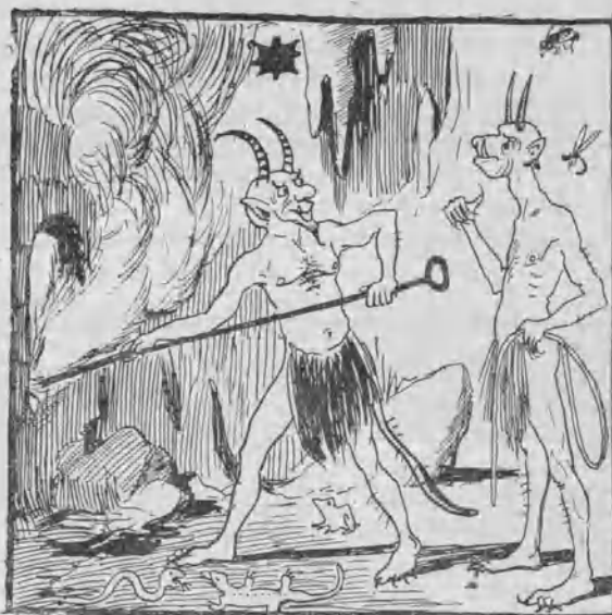
En el infierno.

— Ahí tienes expuestos varios cuchillos para degollar señoras, algunas ganzúas y otros varios instrumentos de trabajo. — ¿Y cómo se llama este pabellón? — El pabellón nacional.