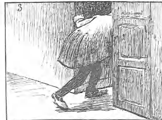
—Y os aseguro que mi venganza ha de correr pareja con vuestra criminal acción.