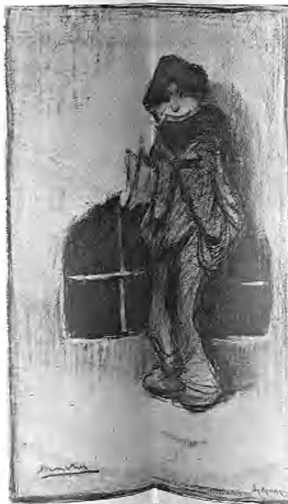
MANOLILLO (Esbozo de Sancha).

Primero una mancha gris. Después, muy poco á poco, el naciente día va tonalizando con dudosa claridad celeste las anchas aceras y las fachadas llenas de rótulos. Bajan por la calle de la Montera los harrenderos provistos de palas y escobas, mientras otros funcionarios de la limpieza pública lanzan cataratas de sus mangas de riego sobre los encharcados adoquines de la Puerta del Sol.