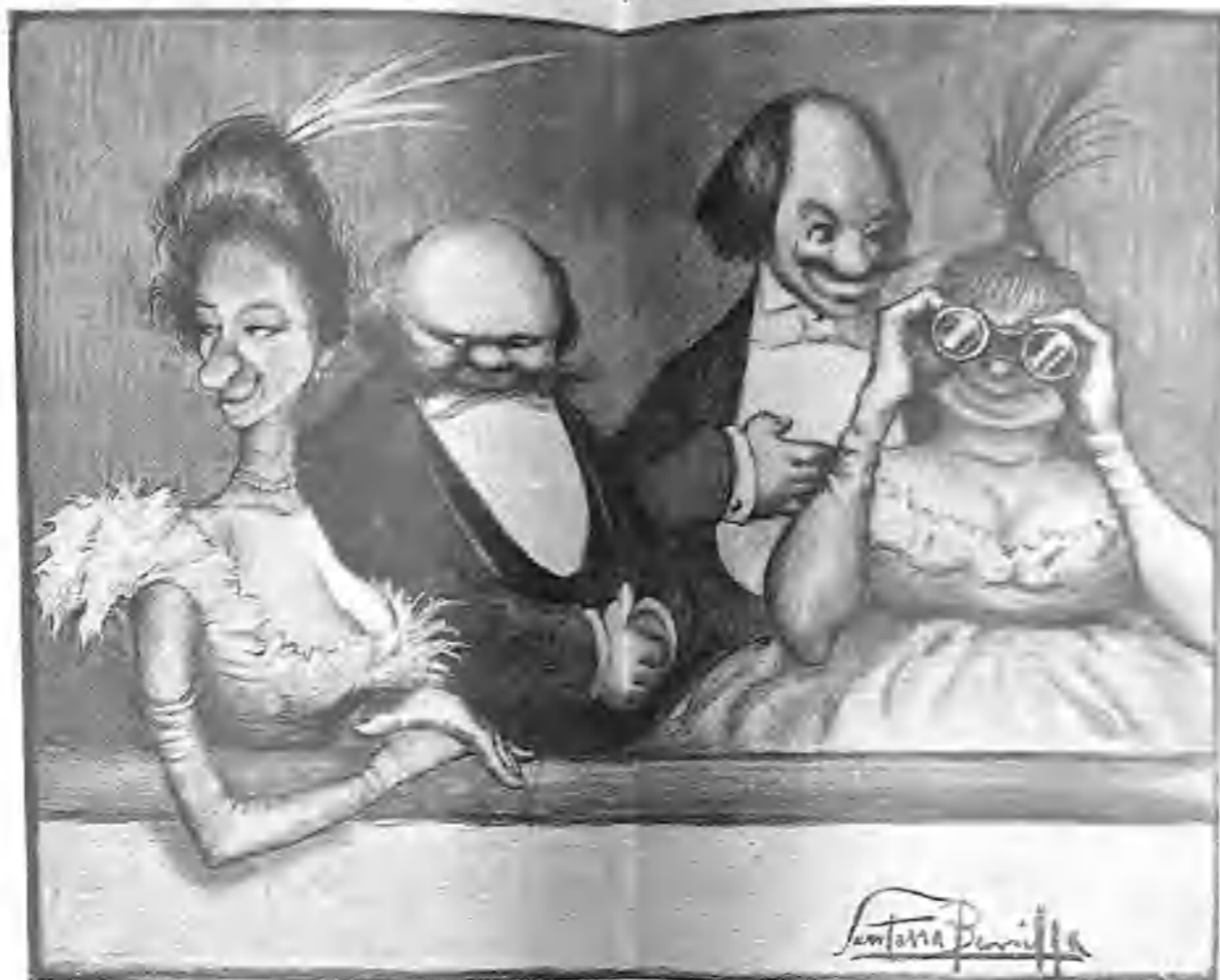
—¡Dios mio, la última de abono y aún no me he atrevido! ¡En cambien el telón se lo digo, vaya si se lo digo!

Siempre madruga más el vicio que la honradez.