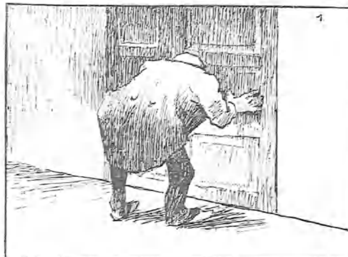
—¡Cielos, qué veo!