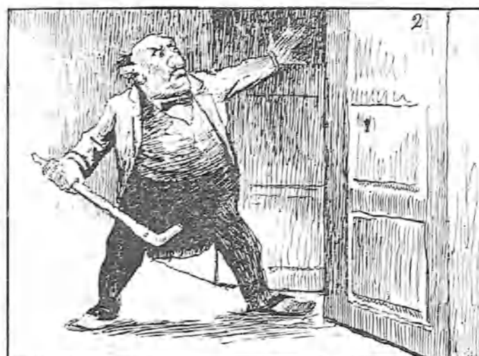
—¡Infames! ¡Ahora váis á saber quién es D. León de la Hiena!...